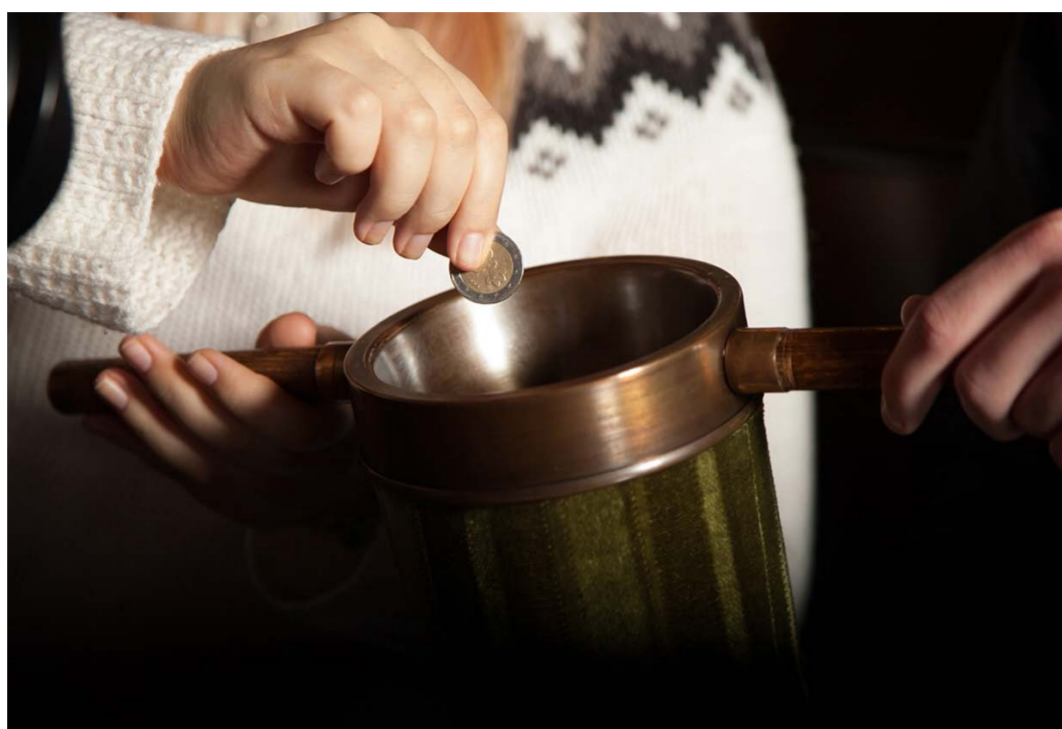
Pahimpaan korona-aikaan keväällä jumalanpalveluksia ei järjestetty lainkaan, jolloin myös kolehdit jäivät keräämättä. Monissa järjestöissä ja seurakunnissa on mietitty uudenlaisia tapoja lahjoittaa perinteisen kirkossa kerättävän kolehdin rinnalle.