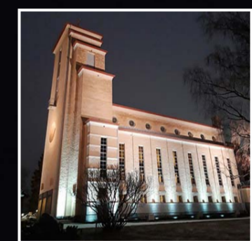
Kun värit eivät ole käytössä lämmin ja kylmä valkoinen sävy vuorottelevat seinän pinnalla.