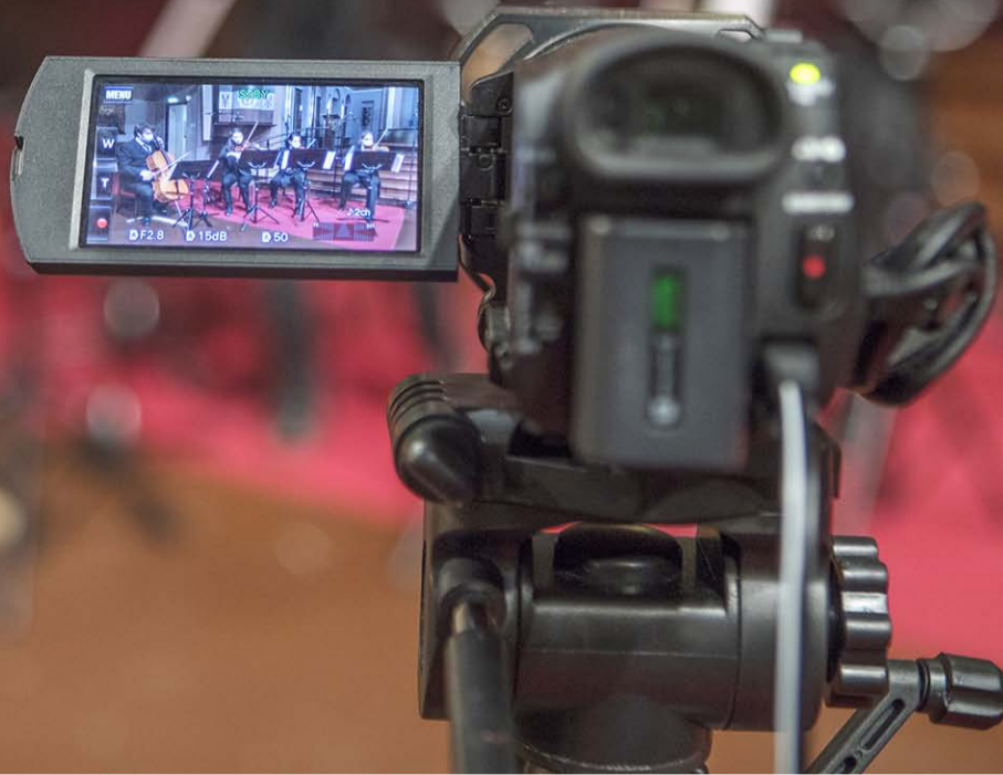
Taulumäen kirkossa marraskuussa tallennettu joululauluvideo julkaistaan seurakunnan nettisivuilla ja Youtube-kanavalla joulukuussa.