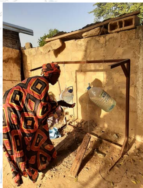
Senegalissa koronaa vastaan on taisteltu muun muassa jakamalla tietoa hygieniasta.

Nyt tilanne Senegalissa on parantunut huomattavasti ja rajoituksia on viime aikoina purettu ja työ on päässyt jatkumaan pitkälti entiseen malliin. Tässä vaiheessa on kuitenkin erityisen tärkeää, että ihmiset muistavat noudattaa ohjeita, ja kumppanimme jatkavat aktiivisesti koronasta tiedottamista.”