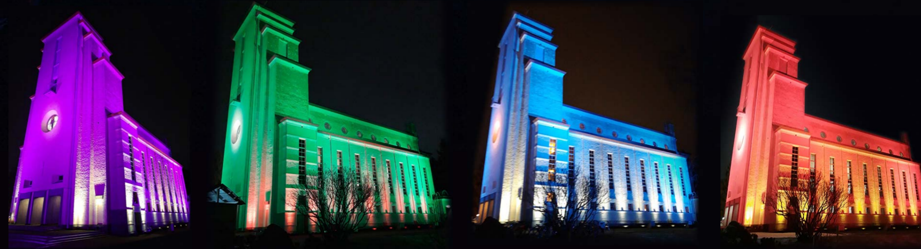
Perjantaina viisi eri värisävyä vaihtuivat minuutin välein. Väreinä olivat muun muassa purppura ja vihreä