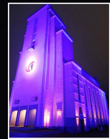
Valaistusta voidaan jatkossa säätää myös kirkkovuoden pyhiin liittyvien liturgisten värien mukaan. Violetti on paastonajan väri.