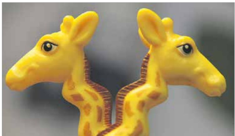
Vapaus ja välittäminen ovat tärkeitä ystävyydessä – ystävyyden ei mittaa aikaa eikä välimatkaa. Vapaus ja välittäminen ovat tärkeitä ystävyydessä – ystävyyden ei mittaa aikaa eikä välimatkaa.

muistaa hienotunteisesti siirtyä syrjemmälle. – Kun tapaan kaverin tai tuttavien, niin mietin, onko kotona siistiä tai onko tukka hyvin. Kohtaaminen voi viedä energiaa. Ystävän tapaamisesta saan energiaa. Kohdautuu vaikka vintin siivoukseen, yhteiseen arkiiraadantaan. – Ystävänä osaa olla lähellä mutta