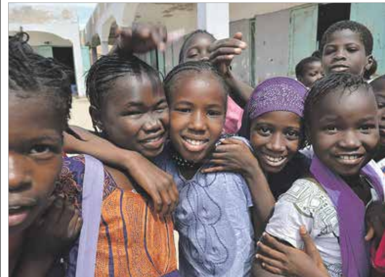
Mauritanialaiset työt ovat päässeet kouluun suomalaiskummien tuen ansiosta. Lähetyksseuran kummitoiminta alkoi vuonna 1988.

Suomen Lähetyksseura on allekirjoittanut muiden suomalaisten kummilapsijärjestöjen kanssa kummilapsitoimintaa koskevan yhteisen eettisen ohjeiston. Allekirjoitettuihin toimintatavoissa edistetään lapsen perus- ja ihmis-