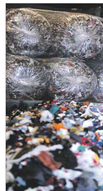
Tilkut suodattavat hulevisiä.