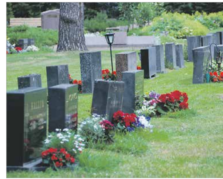
Noin sata kesätyöntekijää kunnostaa Jyväskylän seurakunnan hautausmaita ensi kesänä.

Kesätyöistä Jyväskylän seurakunnan hautausmailla oli tänä vuonna kiinnostunut 743 hakijaa. Kesäksi 2015 palkataan noin sata kausityöntekijää.