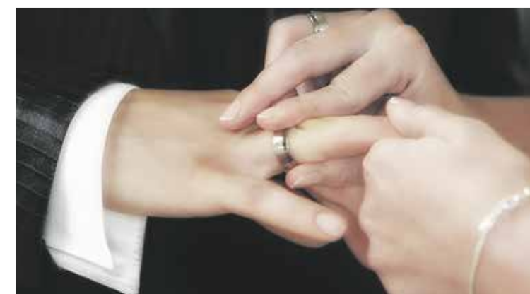
Kirkollisista toimituksista kuten häistä, hautajaisista ja kastajuhlista on luvassa selkokieliset mukautukset.

Suomen evankelis-luterilainen kirkko vahvistaa selkokielistä työtään. Jumalanpalveluksesta sekä kirkollisista toimituksista on koekäytössä selkokielelle mukautetut versiot. Selkokielisissä jumalanpalveluksissa ja toimituksissa li-