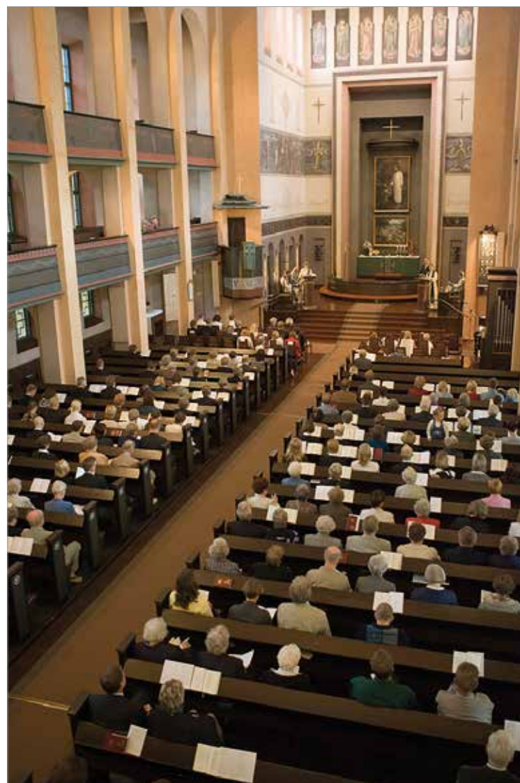
Yli neljä miljoonaa suomalaista kuuluu yhä evankelis-luterilaiseen kirkkoon. Myös muiden uskonnollisten yhdyskuntien määrä on Suomessa lisääntynyt.

Komulaisen mielestä suomalaisessa yhteiskunnassa pitäisi uskonnon marginalisoimisen sijaan luoda entistä enemmän puitteita erilaisten yhteisöjen näkyvyydelle ja uskonnolliselle itselmaiselle.