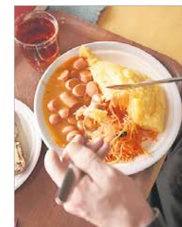
Värikästä, maistuvaa ja terveellistä kotiruokaa, palanpainikkeena hyvä seura.