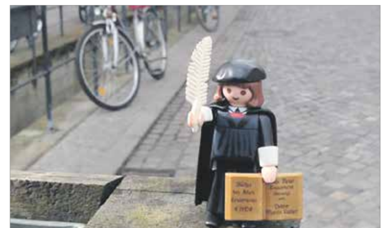
Playmobilin valmistama Luther-hahmo tepastelee saksalaisen kaupungin kadulla kädessään Raamattu ja sulkakynä.

ti. Ensimmäinen tuotantoerä eli 34 000 Lutheria myytiin loppuun 72 tunnissa, minkä jälkeen firman pääkonttorilta singahti Maltaan tehtaille käsky käynnistää uuden erän valmistus. Innokkaat Luther-fanit tosin joutuvat odottamaan taskukokoista hahmoa huttuun loppuun saakka. Ehkä he toteavat kohtaloonsa tyytyn, että tässä jonotat enkä muuta voi.