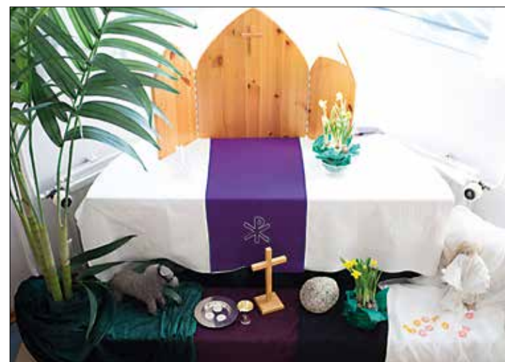
Huhtasuon kirkon päiväkerhuhuoneen ikkunasyvennykseen on rakennettu kaunis pääsiäisalttari.