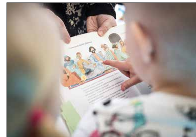
Päiväkerhon hartaushetkessä keskustellaan siitä, mitä pääsiäisenä tapahtui. Pääsiäiskertomus herättää lapsissa paljon kysymyksiä.