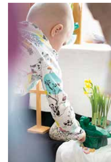
Jooa Tyyskä asettelee koristekukkaa pääsiäisalttarille ilon merkiksi.