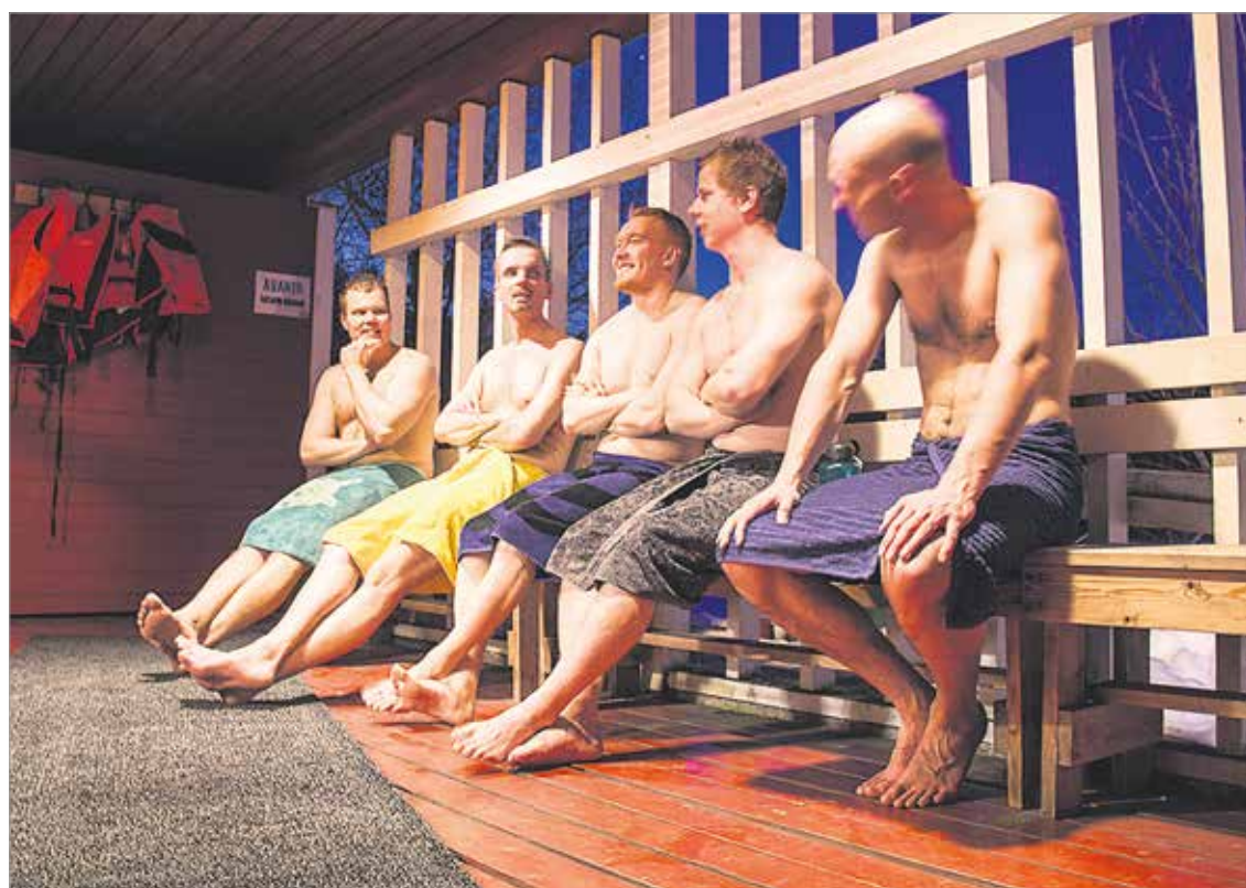
Jalkapallo-ottelun jälkeen on mukava rentoutua saunassa. Samalla kuulee, mitä kaverille kuuluu. Vesalan miestenillassa ajatusten ja kokemusten vaihtaminen on mukatonta ja arkista.