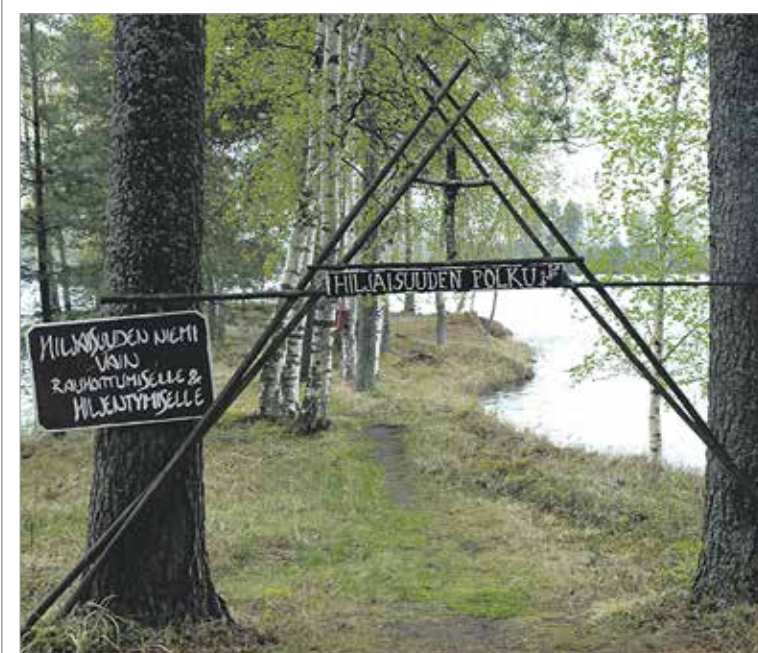
Kirkko on puhunut ympäristön kannalta kestävästä elämäntavasta puolesta ja materialismia vastaan. Jyväskylässä Lehtisaari pitää esillä näitä teemoja.

Suomen evankelis-luterilainen kirkko on saanut Suomen luonnonsuojeluliiton tärkeimmän ympäristöpalkinnon ansioituneesta työstään ympäristön ja luonnon hyväksi. Palkintoperusteissa mainitaan kirkon uutta luova ympäristötyö sekä kirkon toiminta vastavoimana aikamme materialismille. Luonnonsuojeluliiton mukaan kirkko on tehnyt arvokasta ympäristötyötä esimerkiksi tuomitsamalla ilmasto-ohjelmassaan ympäristön hävittämisen synniksi. Kirkko on myös puhunut ympäristön kannalta kestävästä elämäntavasta puolesta.