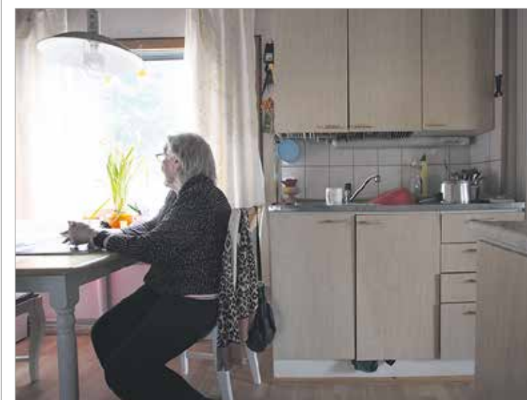
Moni ikääntyvä kokee yksinäisyyttä ja turvattomuutta. Senioripysäkkitoiminta vastaa yksinäisyyden haasteeseen tästä lähtien myös Jyväskylässä.

Ikääntyminen tuo elämään suuria muutoksia kuten eläkkeelle jääminen, läheisistä ihmisistä luopuminen ja oma tai läheisen terveyden heikkeneminen. Huolet painavat, ja siitä voi seurata alakuloisuuden