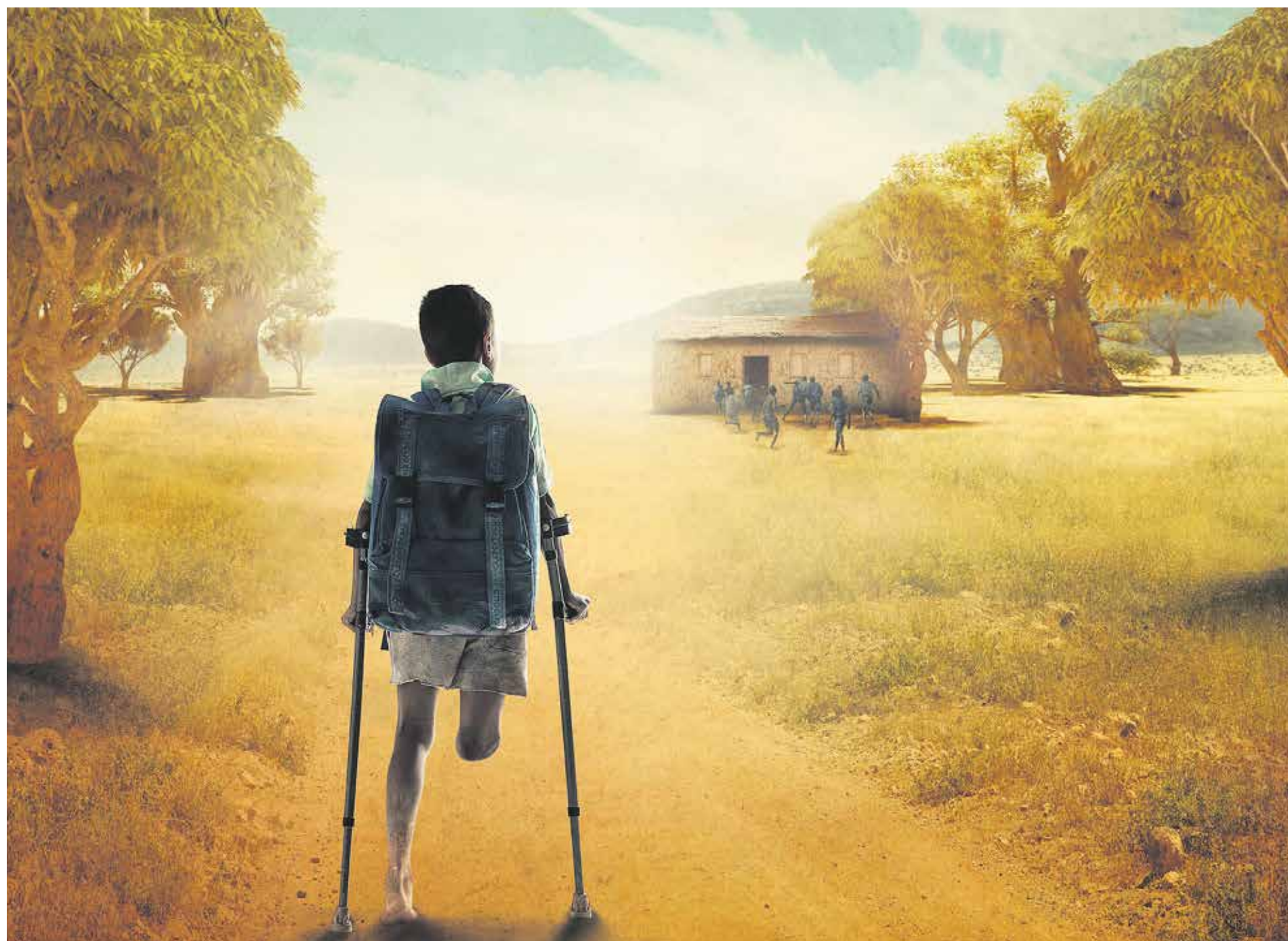
Kehityksissä vain kolme vammaista lasta sadasta pääsee koulun. Koulutien esteinä voivat olla asenteet, vanhempien varattomuus tai se, että koulumatka vain on pitkä ja hankala. Suomen Lähetysseuran Tasaus-kampanja auttaa vammaisten lasten kouluunpääsemistä. Lähetysseura ja sen yhteistyökumppanit vaikuttavat myös vanhempien ja viranomaisten asenteisiin.

Tavaroita hankiessa pyrin miettimään sen tarvetta ja kestävyttä sekä mahdollisuutta hankkia tavara käytettynä. Ympäriillämme on hädänalaisia ihmisiä joille voi lahjoittaa mammonaa, jonka on tullut hankki-neeksi mutta ei tarvitse. Rahan lahjoittaminen vaikkapa Kirkon Ulkomaanavun kautta tasoitaa omistamisen epäsuhtaa, joka maailmassa on.