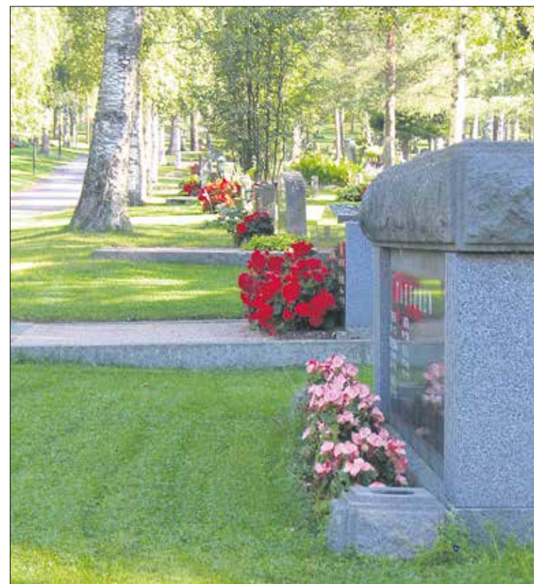
Kirkon yhteiskunnallisiin tehtäviin kuuluu hautausmaiden lisäksi väestökirjanpito sekä kulttuurihistoriallisesti arvokkaiden rakennusten ja irtaimiston kunnossapito.

Lakisääteistä valtion maksamaa korvausta puoltaa se, että se on suhdanneherkkää yhteisöve-