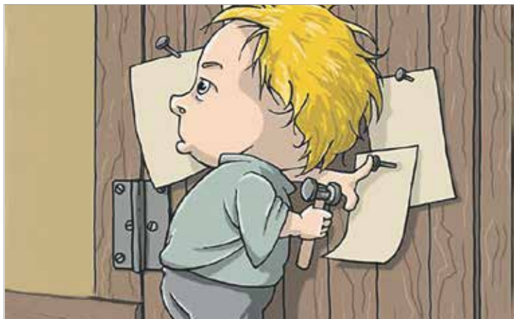
Vasaroiko lapsesi lappuja oveen? Ei syytä huolestua. Tai voi olla paljonkin syytä huolestua.

Martti Luther sai nimensä Martinus -pyhimyksen mukaan. Martinus oli sotilas, joka halkaisi viitansa kahtia ja antoi toisen puoliskon palelevalle kerjäläiselle. Seuraavan yönä hän näki näyn, joka paljasti kerjäläisen olleen Jeesus. Martinus otti kasteen, ryhtyi lähetystyöhön ja päätyi lopulta Toursin piispaksi. Pyhän Martin hautajaispäivää 11.11. alettiin viettää hänen muistopäivänään. Martti Luther syntyi 10. marraskuuta, ja 11. marraskuuta hänet kastettiin Pyhän Martin kaimaksi.