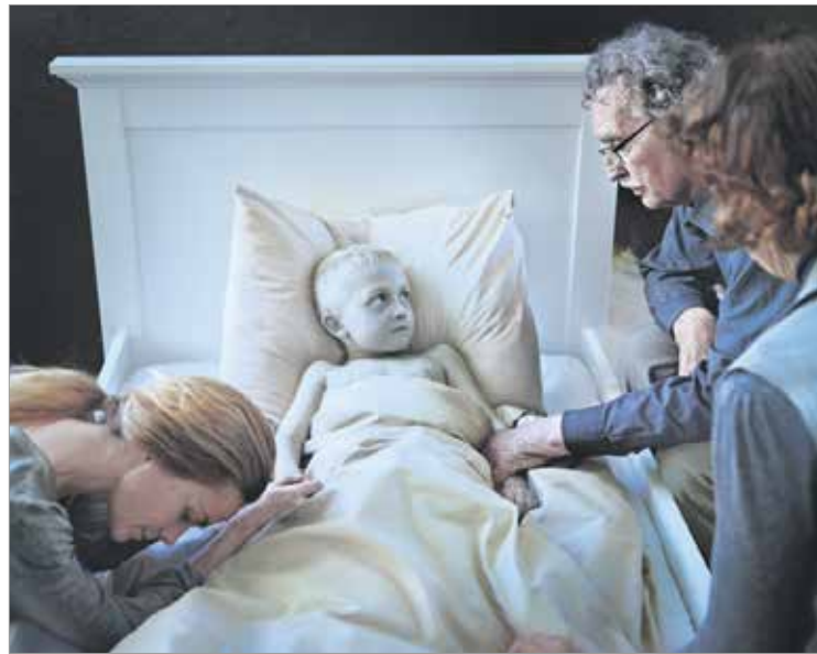
Vuoden 2014 Yhteisvastuukeräyksen kotimaan osuus on kohdennettu saattohoidon kehittämiseen. Kampanjan kuvat herättivät hämmennystä.