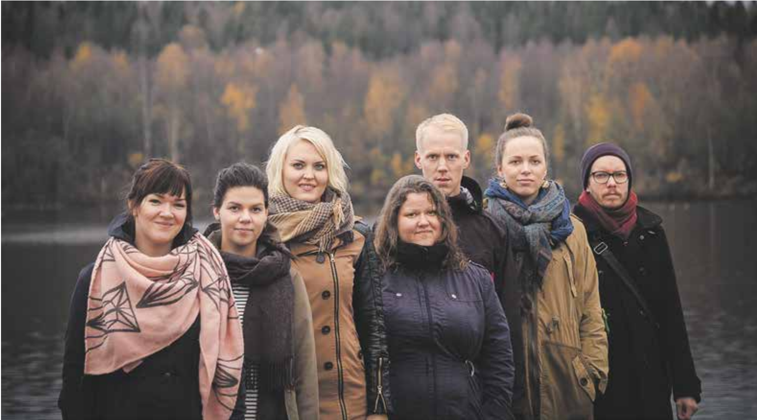
Jyväskylän ammattikorkeakoulun musiikinopiskelijat esiintyvät kolmessa Ei yksin leivästä -konsertissa. Opiskelijat haluavat muistuttaa, että hyväntekeväisyydessä tarvitaan muutakin kuin aineellista annettavaa, esimerkiksi kulttuuria.