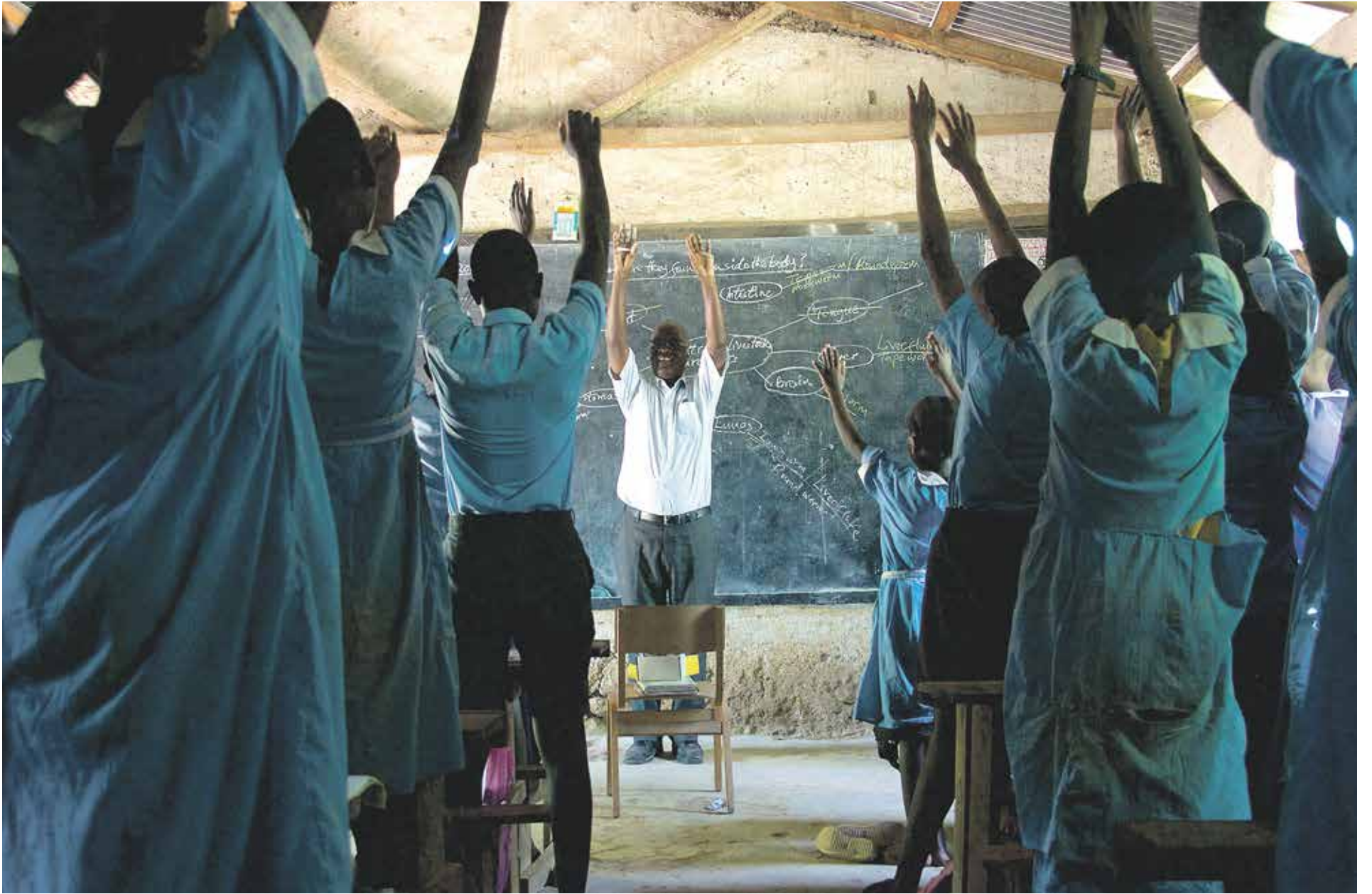
Saviseinäinen luokkahuone kuumenee iltapäivällä, ja oppilaiden tarkkaavaisuus herpaantuu. World Teacher -ohjelmaan osallistuvat suomalaiset vinkkasivat, että pieni taukoliikunta kesken oppitunnin tuo lisää viireyttä iltapäivään.