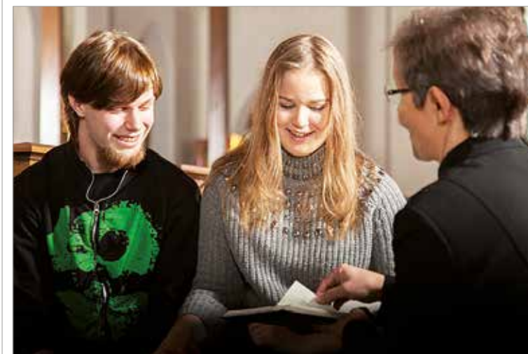
Oppilaitoksesta tuttu pappi pyydetään usein myös perheen juhlatilaisuuksiin. Tässä suunnitellaan häitä.

– Oppilaitoksesta tuttu pappi pyydetään usein myös perheen juhlatilaisuuksiin. Viime vuonna oppilaitostyön kautta tuli noin 250 kutsua kasteisiin, hautajaisiin ja vihkipapiksi, Murtovoori kertoo.