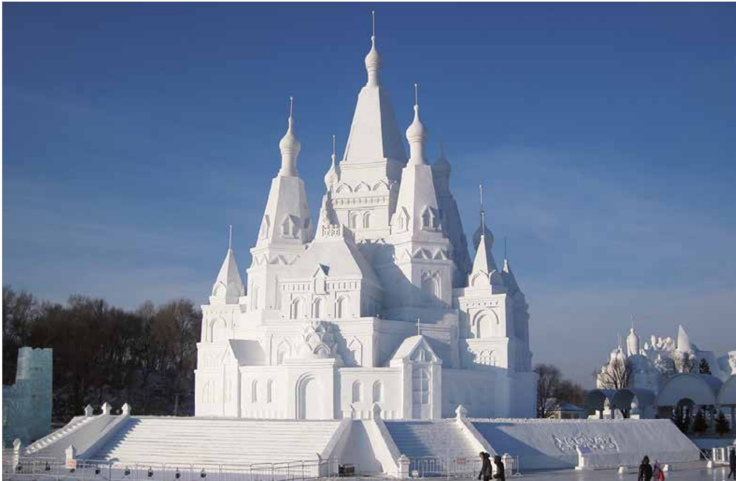
Kiinan Harbiniin rakentuu kahden kuukauden ajaksi reilun 20 hehtaarin kokoinen lumi- ja jääkaupunki. Yksi kaupungin rakennuksista on 50 metriä korkea kirkko. Katoava kauneus kestää mannerilmastossa kaksi kuukautta. Sitten se muuttuu vedeksi ja palaa luonnon kiertokulkuun.