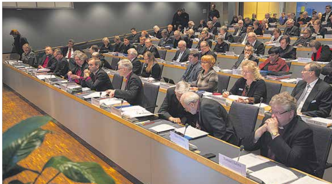
Kirkolliskokous on kirkon ylin päättävä elin, jonka toimikausi on neljä vuotta. Kirkolliskokouksessa on sekä maallikko- että pappisedustajia. Lapuan hiippakunnasta kirkolliskokouksessa on kolme pappis- ja seitsemän maallikkoedustajaa.