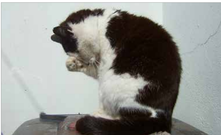
Koiraihmissen rukouskirja? Mitä? Emäntä – et kai ole mennyt sellaista ostamaan? Pitääkö minun huolestua?

Kiitos kissasta, joka pomppaa sänkyyn kello 3.30 aamuyöllä, hyppi selkäni päällä ja naukuu ruokaa. Se opettaa sinnikkyyttä ja hellittämättömyyttä. (Vaikka kyllä se ärsyttääkin. Söisi niitä kuivia raksujaan.)