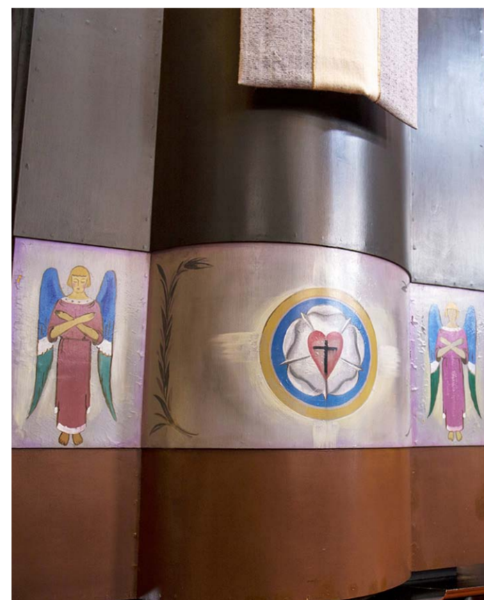
Taulumäen kirkon saarnatuoliin on maalattu Luther-ruusu.

Uudelleen löytämänsä vanhurskauttamisopin Luther tiivistä kolmeen sanapariin: yksin usko, yksin armo, yksin Kristus. Tätä reformaattorista löytöä myös Luther-ruusu eli Lutherin vaakuna kirkastaa.