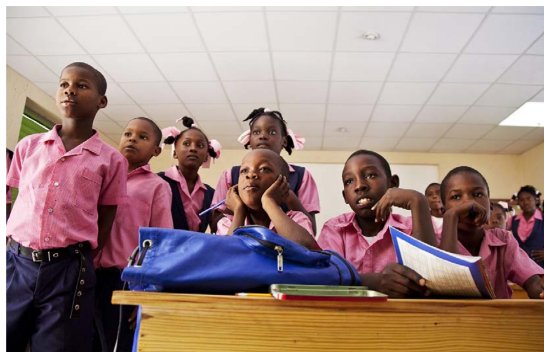
Yhteisöt arvostavat erittäin paljon Kirkon Ulkomaanavun Haitiin rakentamia kouluja.