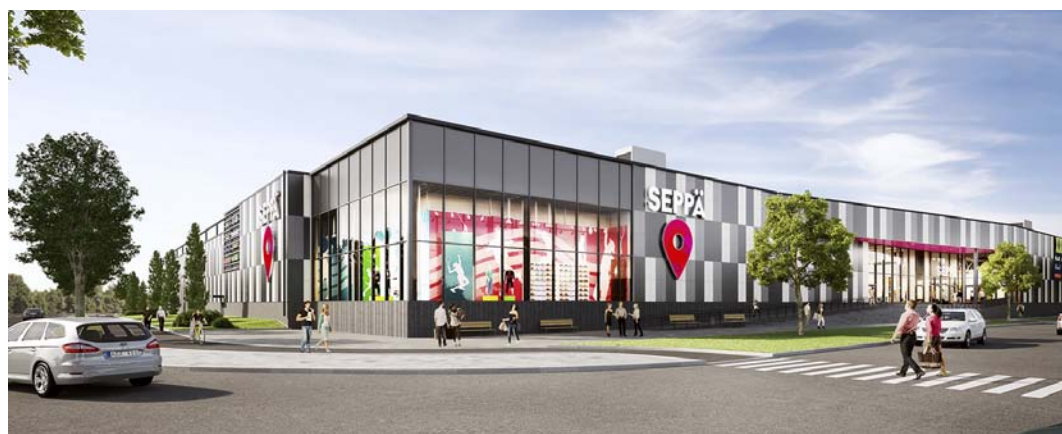
Uudet tilat Kauppakeskus Sepässä avaavat uusia mahdollisuuksia Huhtasuon alue seurakunnan toimintaan. Tilat palvelevat myös monia muita seurakuntalaisia.