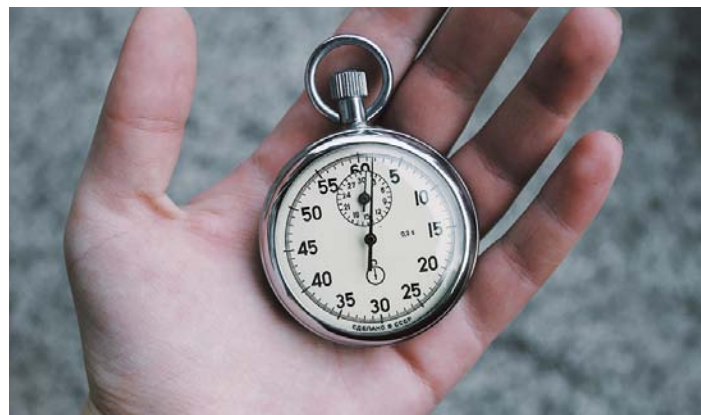
Joskus minuuttikin on pitkä aika. Ainakin riittävä.

Näin hemmotellaan kristillisen mystiikan ystäviä. Seuraavaksi odotan teoksia, jotka opastavat yhtä instant-meiningillä myös muiden uskonnollisten suuntausten perinteisiin. Minuutissa mystiä -kirjan rinnakkaisteos on Minuutissa metodistiksi . Tämä uskonsuun-