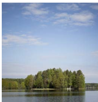
Lehtisaari avaa ovensa 10.6.

Saaressa voi edellisten kesien tapaan vierailla vapaasti, kunhan ottaa huomioon saaren aukioloajat. Myös tutut aktiviteetit ovat mahdollisia. Saunominen onnistuu ja grillipaikkojen on tarjolla. Saarel-