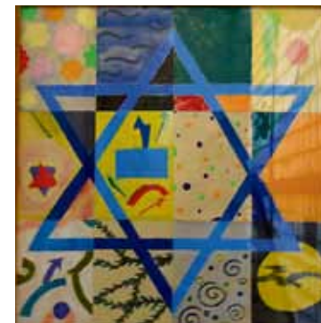
Piirros juutalaisen koulun käytävästä.

– Maallistuneessa juutalisperheessä lapsen on vaikea omaksua identiteettiä. Sama koskee maallis-