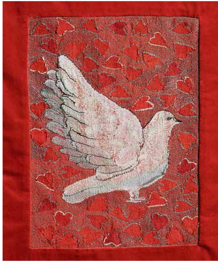
Helluntai on Pyhän Hengen juhla, jota vietetään 50 päivää pääsiäisen jälkeen. Kyyhkynen on yksi Pyhän Hengen symboleista.