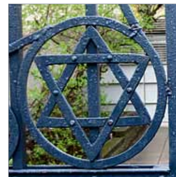
Daavidin tähti portissa.