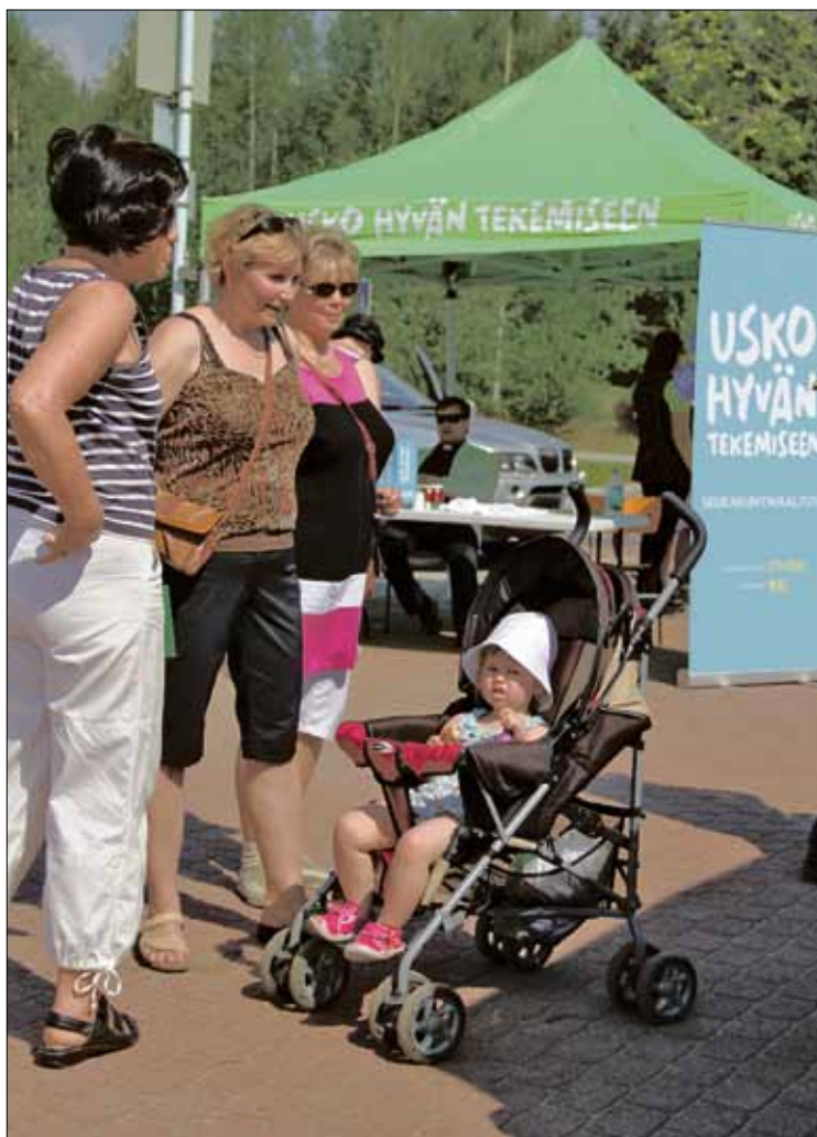
Palokan Suvivirsitapahtuma kokosi Palokan torille seurakunnan toiminnasta kiinnostuneita ihmisiä. Suvivirsikin kajahti komasti.

Jyväskylässä Hyvän tekemisen toreja on ollut jo muun muassa Kirittären ensimmäisessä kotitillassa sekä Palokan Suvivirsitapahtumassa. Kesän kuluessa Hyvän tekemisen toriinkin voi törmätä vaikkapa Korpialahden Palvipäivillä