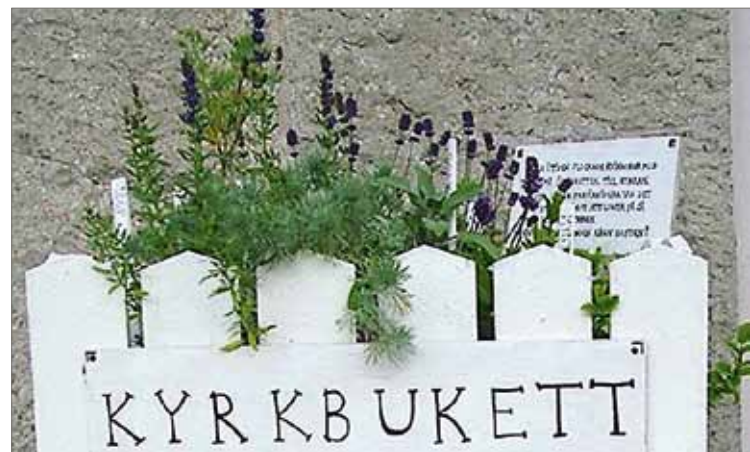
Näin Ruotsissa: Brunflon kirkon oven pielessä on yrtilaatikko. Ennen vanhaan naiset ottivat tuoksuvia yrtejä, jotka pitivät heidät hereillä pitkän saarnan ajan...

Lisätietoja Kankaan puutarhan toiminnasta: http://kankaanpuutarha.wordpress.com/