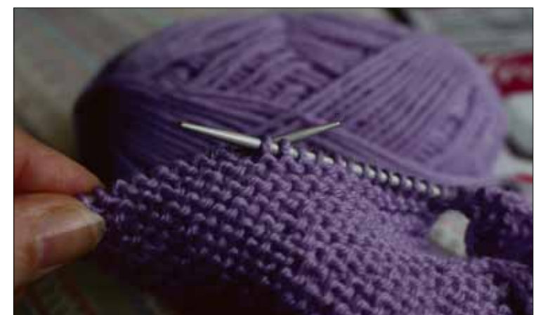
Löytyisikö käsityöihmiselle jostakin cancel-nappi, jolla voisi perua muutaman kerros sitten tapahtuneen virheen.

Paitsi. Ahkerana kaukosäätimen käyttäjänä olen huomannut, että yritän säätää ihmisiäkin ohjenta-televisio kaukosäädintä tai jotain olematonta ja kuvittelemaa-