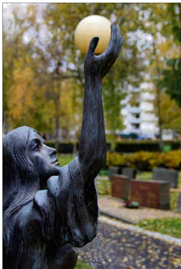
Enkeli, ota koppi! Jyväskylän Vanhan hautausmaan enkelipatsas on selkeä määrittäjä hautausmaahan.

tisuudessa on samantyyppistä bisnestä, hän huomauttaa.