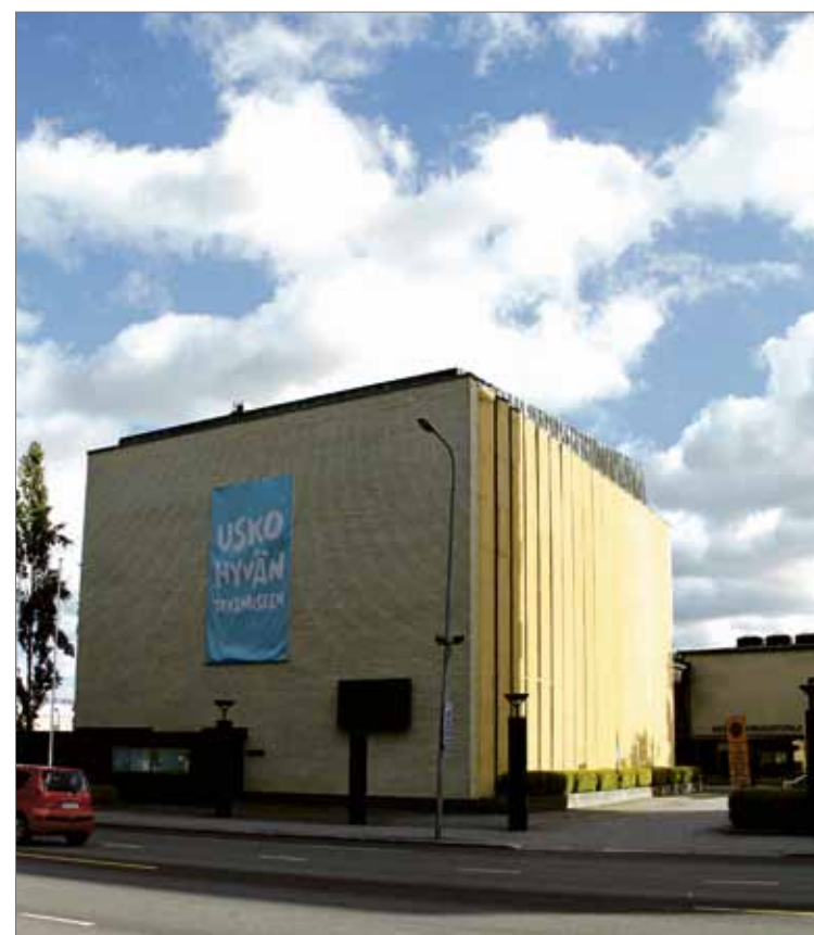
Keskuseurakuntatalon suunniteltu remontti ei muuttaisi juurikaan tätä Yliopistonkadulle avautuvaa näkymää.

Seurakunnalle jäävälle määrälalle on suunniteltu tiloja tällä hetkellä useissa eri vuokratiloissa evakossa oleville seurakunnan työntekijöille. Uuteen taloon rakennetaan työpisteet 60–80 seurakunnan työntekijälle ja kokoontumistiloja.