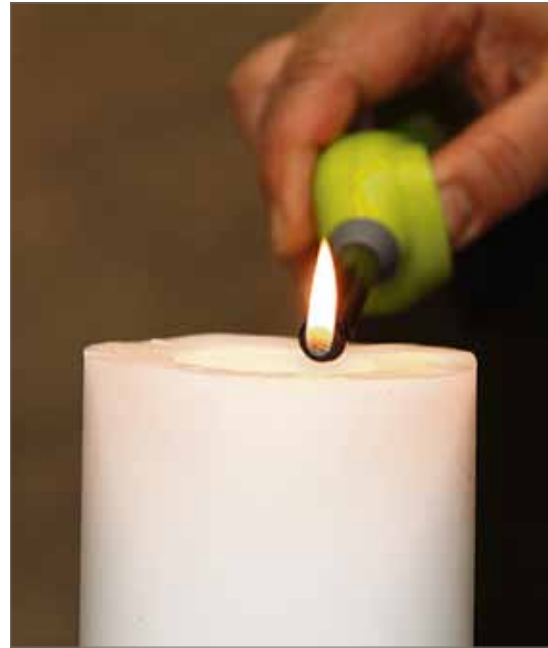
Joulu on pohjimmiltaan muuta kuin tuuppivat ihmiset jouluostoksilla, kinkut ja kodin puunaamisvelvoitteet.

– Keisari Augustus taisteli Pax Romanan , Rooman rauhan, Välimeren alueelle 250 vuoden ajaksi. Pax Christi , Kristuksen rauha, ei