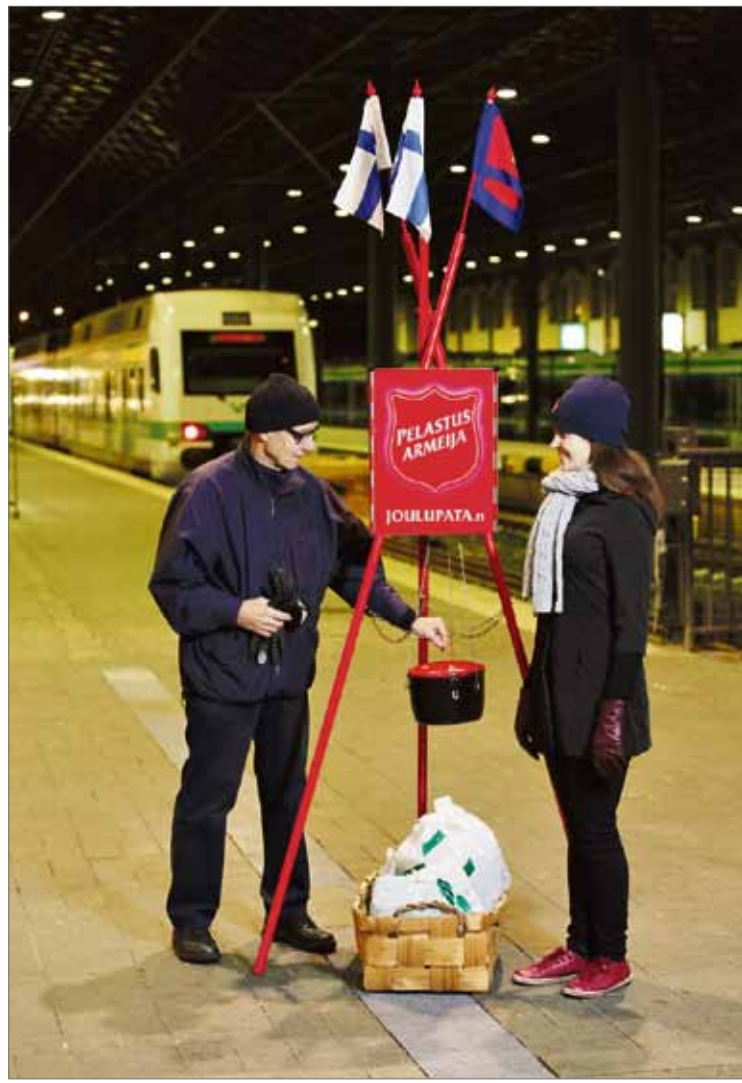
Ensimmäiset Joulupadat ilmestyivät noin sata vuotta sitten Helsinkiin. Rautatieasema on hyvä patapaikka. Jyväskylässä patoja on seitsemän.

Joulupadat ilmestyivät Helsingin kaduille ensimmäisen kerran 1900-luvun alussa. San Franciscosta vuonna 1891 lähtenyt tapa kerätä rahaa vähävaraisille on va-