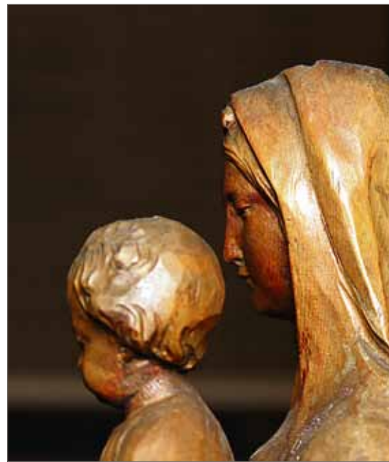
Jouluna Jumala syntyi, pyhä Poika pakkasella, sanoo kansanruno. Ilo ja kristillisuus mahtuvat samaan jouluun.