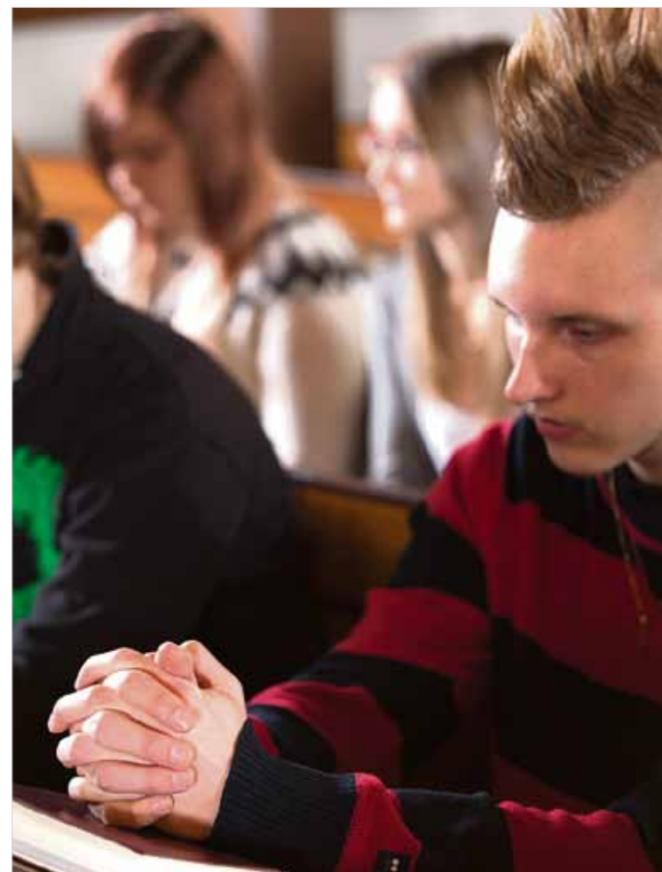
Rukous voi olla tutun ilta- tai ruokarukouksen tai Isä meidän -rukouksen lukemista tai tilanteen synnyttämää sanallista tai hiljaista ja meditatiivista rukousta.

Myös aiemmin on ollut ihmisiä, joiden luo on tultu pyytämään esirukousta. Esimerkiksi ortodoksis-kirkossa on ollut ja on edelleen ohjaajavanhuksia. Rukoilijat ovat kaihtaneet julkisuutta, eikä rukousvastauksia ole levitetty. Niihin on suhtauduttu nöyrän kiitollisesti. Uuskarismaattisuudessa parantava rukous on usein irtaantunut kirkko-