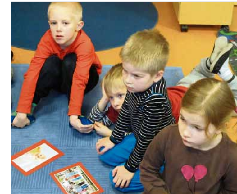
Päiväkerhon hartaushetkessä pohdittiin ystävyyttä erimaalaisia lapsia esittävien korttien avulla. Voinko olla ystävä erilaiselle lapselle? Voin, kuului vastaus.

▶ Kaikissa alue seurakunnissa järjestetään päiväkerhoja. Kerhot ovat maksuttomia. Lisätietoja kaikesta lasten ja perheiden toiminnasta: www.jyvaskylanseurakunta.fi . Ilmoittautuminen ensi syksynä alkaviin kerhoihin huhti-toukokuun vaihteessa. Seuraa ilmoittelua.