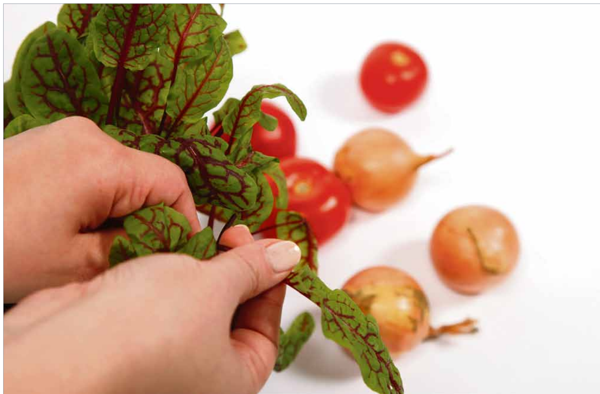
Ruuan valmistuksestakin voi selvitä pienemmällä kustannuksilla, kun tekee tavallista kotiruokaa ja valitsee edullisia raaka-aineita. Ruokaostoksia kannattaa tehdä sesongin mukaan. Kotimaiset vihannekset ovat parhaimmillaan kesällä, ja talvella voi suosia juureksia. Kaikkein kalleinta on ruuan tuhlaminen, joten ruokaa ei kannata valmistaa roskein heitettäväksi.

Ryhmässä emme kysely miehen mittaa emmekä kelpoisuusvaatimuksia. Mikään maan ja taivaan välillä ei ole vierasta. Tämä ryhmä voi olla kuin elämä: haaste ja samalla mielenkiintoisen kokemus.