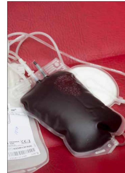
Sopanen luovutti 460 millilitraa verta viidessä minuutissa ja kahdessa toista sekunnissa.