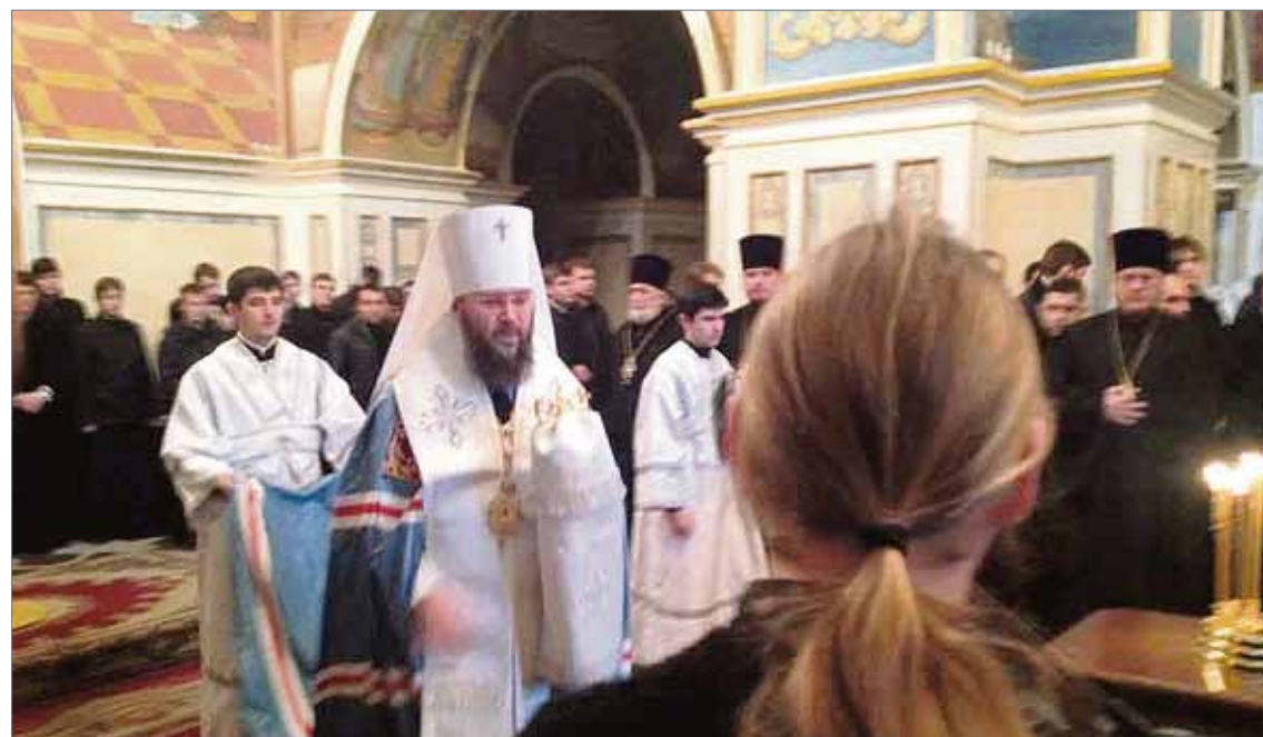
Kiovan luolaluostarissa on järjestetty pаниhidoja eli muistojumalanpalveluksia mielenosoituksissa kuolleiden puolesta. Papit ovat asettuneet ristejä kantaen kihtyneiden väkijoukkojen väliin ja luovuttaneet sairaaloissa verta.