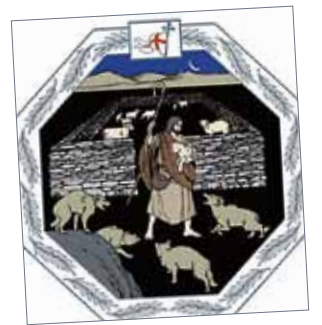
Hyvän Paimenen sunnuntai 4.5.

Hyvä paimen tuntee laumansa, myös eksyneet. Yhä uudelleen hän sanoo: Ystävä, ole rohkea,