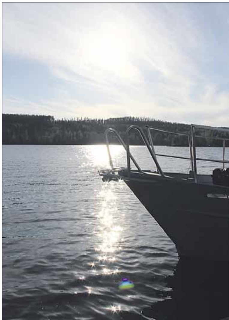
Lämmin ja aurinkoinen toukokuu on hellinyt veneilijöitä.