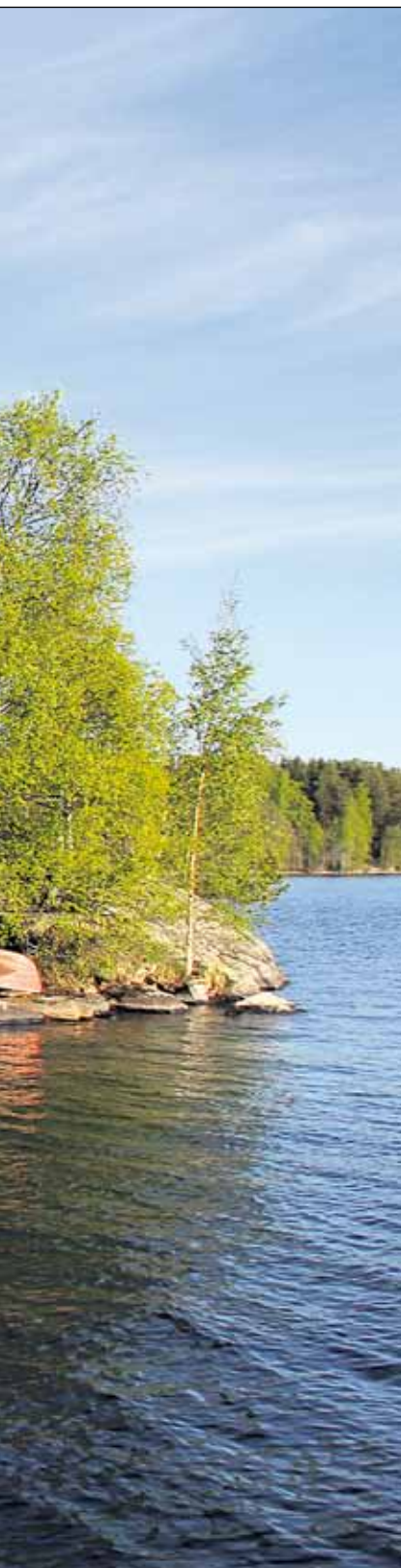
Pieni Konjakkisaari on Jyväskylän järvi- pelastajien tukikohta.