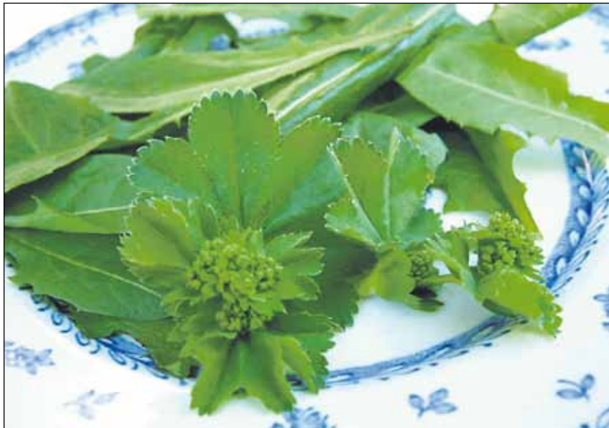
Poimulehtiä ja voikukan lehtiä salaattilautasella.

Tunnistamattomia kasveja ei kannata mennä syömään. Lisätietoja sekä turvallisia lajitunnistekuvia löytyy osoitteesta www.arktisetaromit.fi .