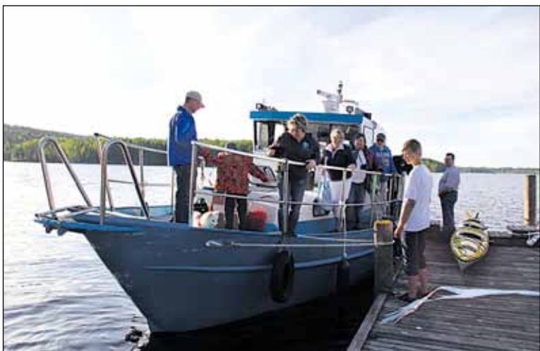
Konjakkisaareen matkattiin m/s Rean kyydissä.