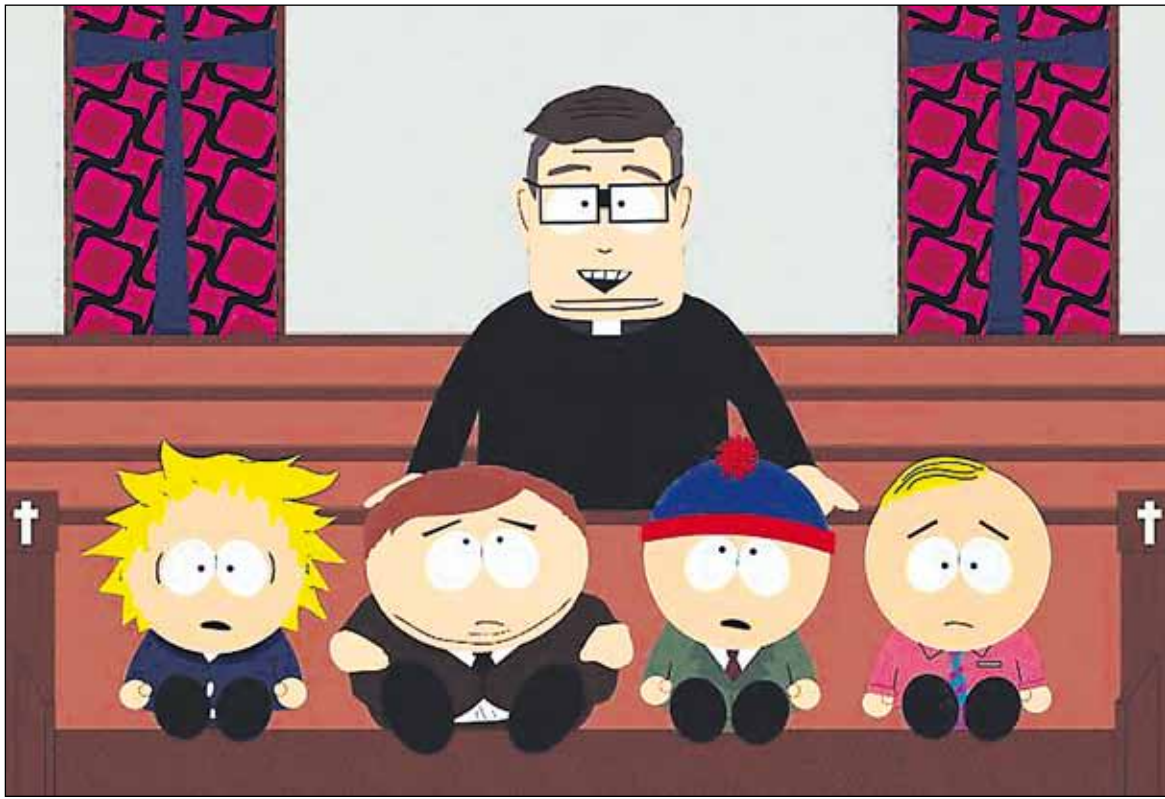
South Parkin neljä poikaa ovat sarjan perushahmot. Sarja nähdään nykyään Jimillä.