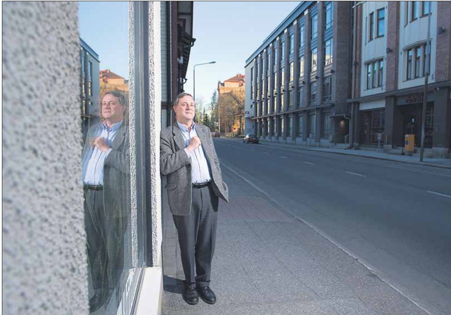
Alister McGrath on kirjoittanut lukuisia kristinuskoa käsitteleviä kirjoja, joita on julkaistu myös Suomessa. Hän on taittanut peistä brittiläisten uusateistien kanssa.