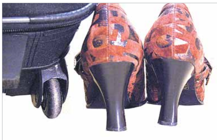
Matkalaukun pyörien rahina ja matkakengien kopina – kuin musiikkia korville? Voit toki kuljettaa ne mukaasi työpäivääkin.

Kiinnittäkää turvavyöt, nyt tämä taas alkaa!