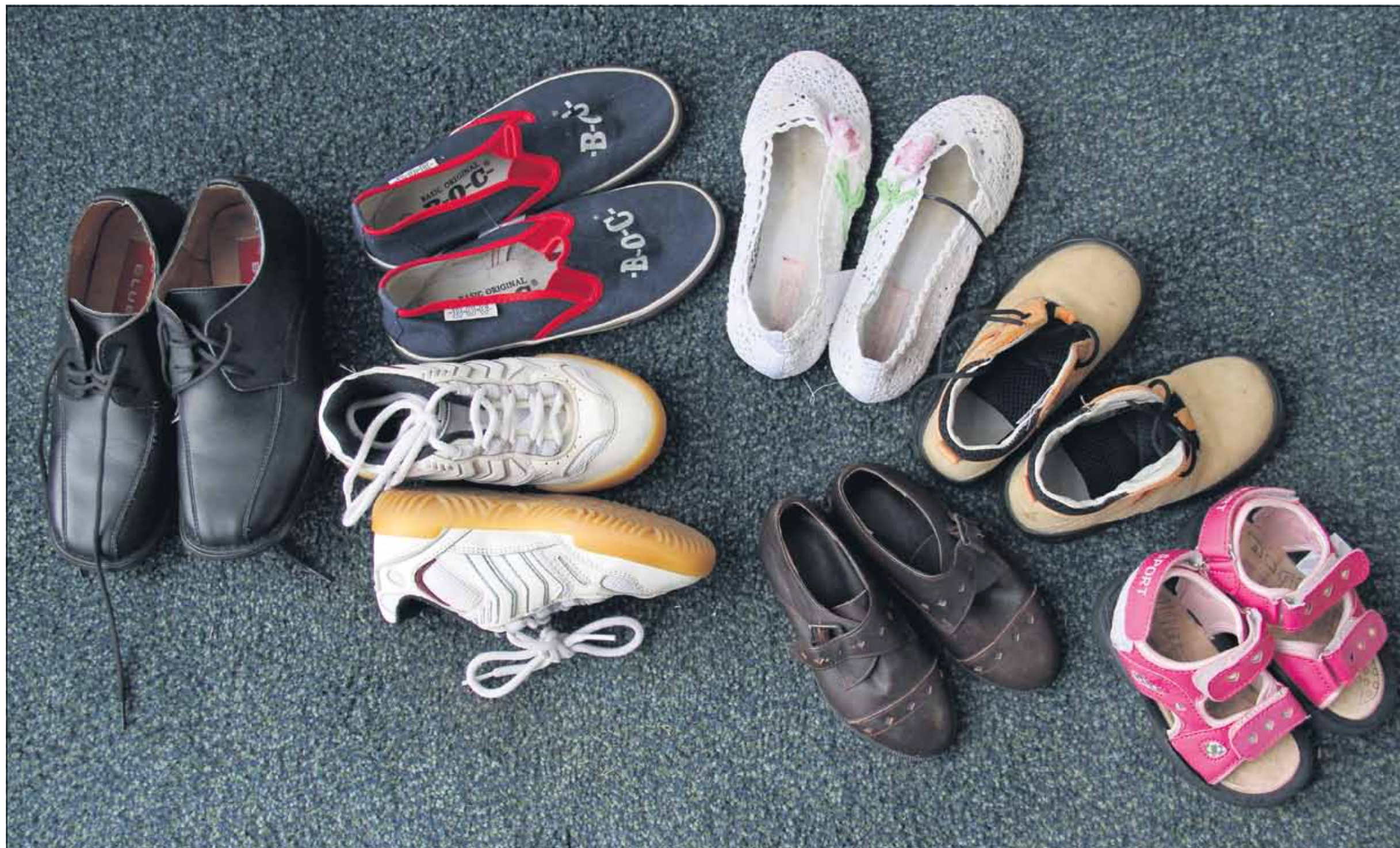
Esikoinen saa joskus liikaakin vastuuta kantaakseen ja oppii elämään sääntillistä elämää. Keskimmäiset kertovat, että ovat oppineet itsenäisiksi ristiriitojen sovittelijoiksi. Kuopukset astelevat usein omia teitään kapinallisen kengissä. Viisaat kasvattajat tasoittavat lastensa syntymäjärjestyksen tuomia eroja.