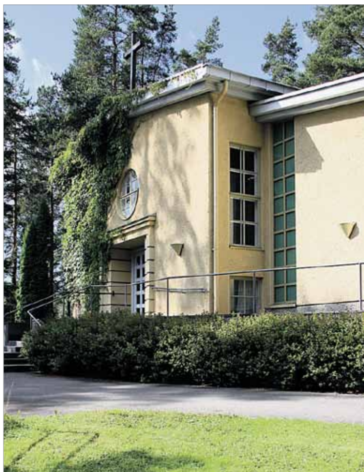
Lahjajarjun kappelissa pidetään nykyään jumalanpalveluksia ja muita kirkollisia tilaisuuksia, koska Lohikosken kirkon käyttöä on rajoitettu sisäilmaongelmien vuoksi.

Lahjajarjun kappelin alakerran kokoumistilassa voidaan järjestää myös kirkkokahveja. Ensimmäiset kirkkokahvit nautitaan messun jälkeen 25.8. klo 12. Samalla on mah-