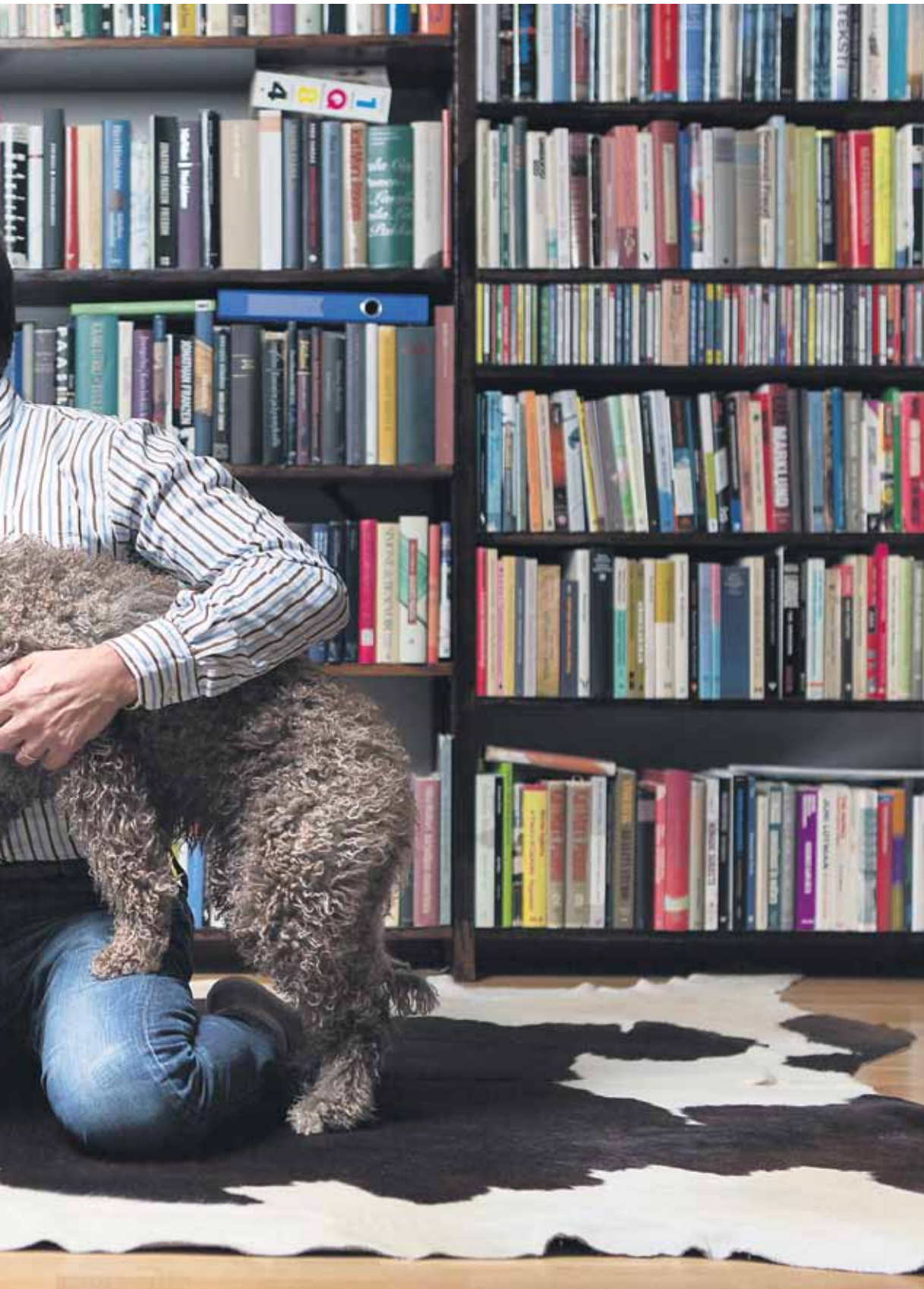
...ritteleminen ei ole enää yksiselitteistä. Biologisten siteiden lisäksi perhe voidaan määrittellä sosiaalisten suhteiden perusteella. Monelle