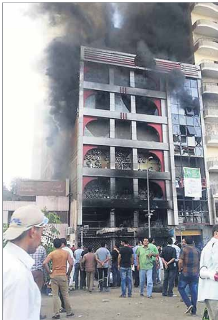
Koptikristittyjen taloja ja kirkkoja on poltettu Egyptissä. Joissakin tapauksissa naapuruston muslimit ovat asettautuneet ihmiskilviksi suojaamaan kirkkoja.

– Itse pelkäsin vallankumouksen jälkeen muun muassa joutuessani mielenosoitusten tai isojen joukkoriitojen keskelle. Varkaudet, väkivaltaisuus ja raiskaukset lisääntyivät. Siksi muutin puolisoni kanssa Suomeen elokuussa 2011.