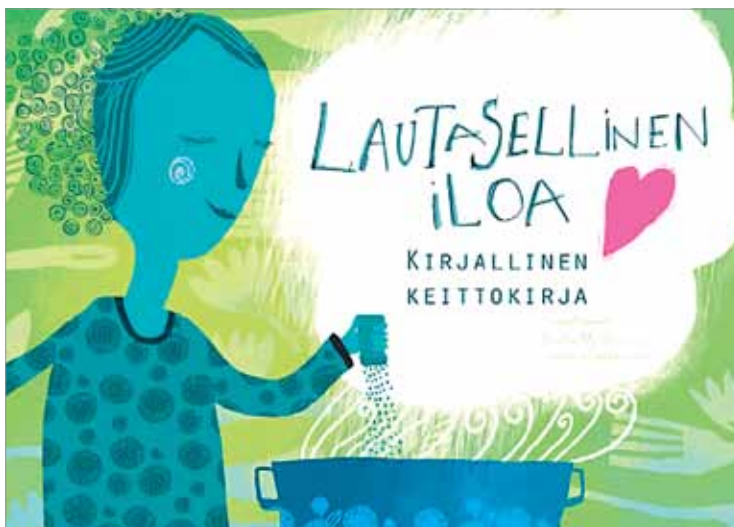
Lautasellinen iloa -kirja tukee Naisten Pankkia, joka edistää kehitysmaiden naisten yrittäjyyttä ja toimeentuloa.

- Ruoka valikoitui teemaksi, koska halusimme etsiä suomalaisia ja kohdemaiden naistenpankilaisia yhdistävää, valoisaa ja voimaannuttavaa aihepiiriä, he kertovat.