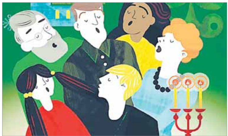
Nuotin viereissä on tilaa. Samoin on tilaa Kauneimmat joululaulut -tapahtumissa, joissa saa laulaa omalla äänellään, muun porukan kanssa.

– Kehittyvien kuoroon sieltä, mars, mars! Kaikki voivat oppia laulamaan. Se vaatii vain vähän harjoitusta!