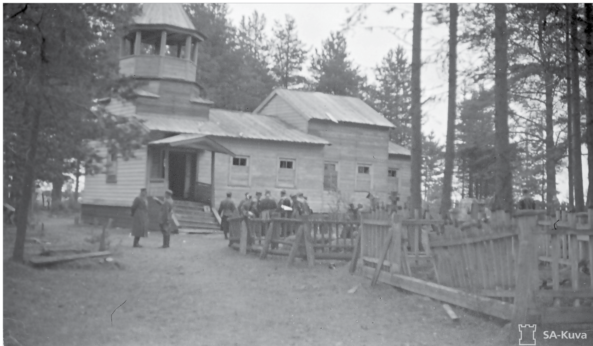
Neuvostoliittolaiset olivat käyttäneet rukajärveläistä Yrjönkirkkoa viljamakasiinina. Kokouksessaan olevia pappeja kirkon edustalla suomalaisiin kirkonmiehiin muistuttamalla, että taistelu saksalaisten rinnalla on myös sotimista yhteisen uskon puolesta ateistisia kenttäpiispan ja divisionankomentajan seurassa syyskuussa 1941. Natsipropaganda vetosi bolševistejä vastaan.