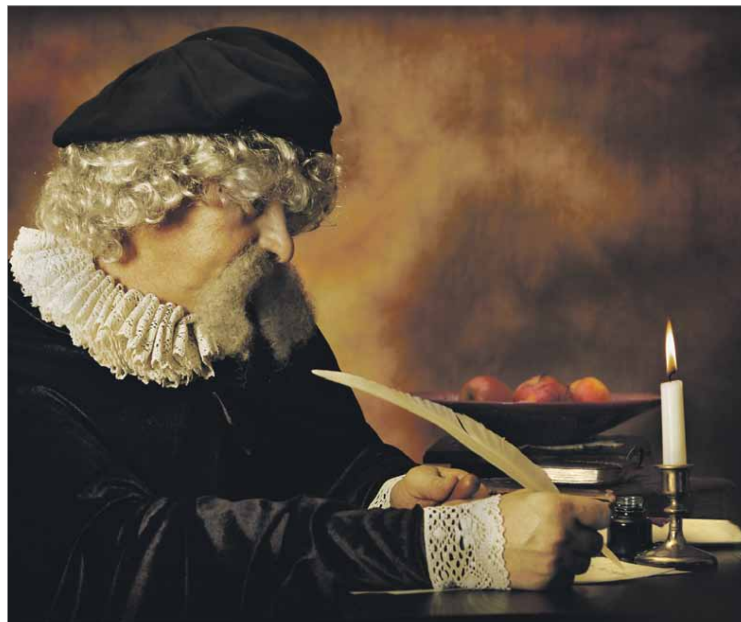
Olisi hyvä, jos testamentin vaihtoehtoja mietittäisiin useampia ja mukaan otettaisiin myös toissijaismääräyksiä. Testamentilla voi muun muassa määrätä, ettei lasten puolisoilla ole avio-oikeutta perintöomaisuuteen.

Selkokieli on suomen kielen muoto, joka on mukautettu sisällyttäen, sanastoltaan ja rakenteeltaan yleiskielistä luettavammaksi ja ymmärrettävämmäksi. Teoksen kielessä, kuvissa ja taitossa on huomioitu yksinkertaisuus ja ymmärrettävyys.