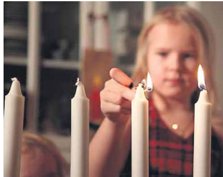
Toisena adventtisunnuntaina syttyä kynttilä nimeltään rauha. Ensimmäisen adventtisunnuntain kynttilä on toivo, kolmannen rakkaus ja neljäs ilo.

Ensimmäisen adventtisunnuntain jälkeisestä maanantaina alkanut jouluaattoon asti ulottuva adventtipaasto. Sitä kutsutaan myös pieneksi paastoksi erotukseksi pääsiäistä edeltävästä suuresta paastosta. Sitä on tosin vaikea heti uskoa, sillä ajanjakso on nykyään lähinnä pikkujoulukautta.