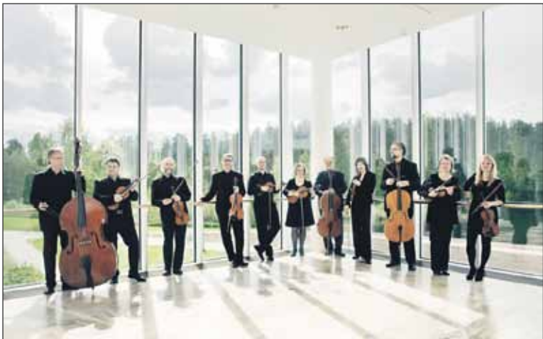
Mikkelin Kaupunginorkesteri esittää Kamarikuoro Cantinovumin kanssa Stabat Matereita.