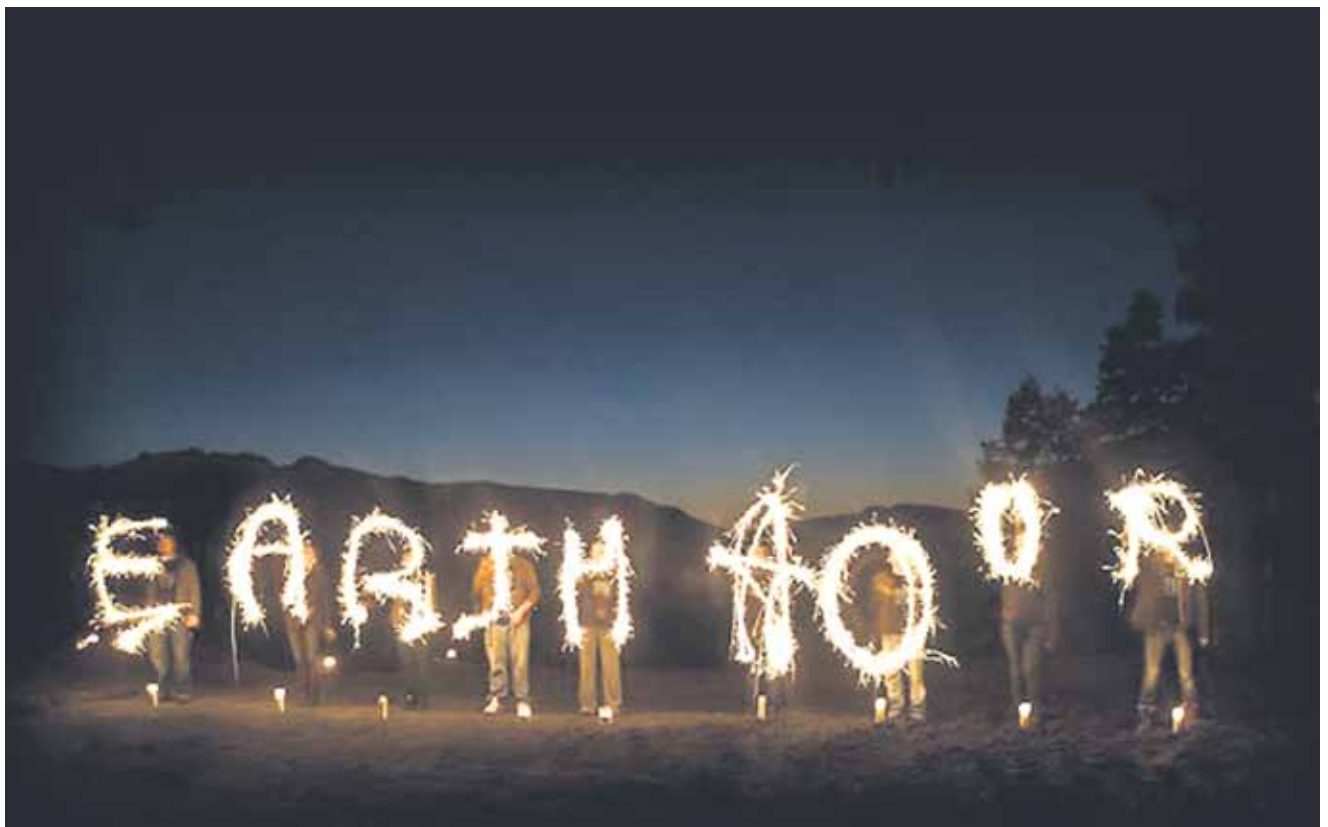
Viime vuonna Earth Houriin osallistui ennätykselliset 152 maata ja liki 6 500 kaupunkia.