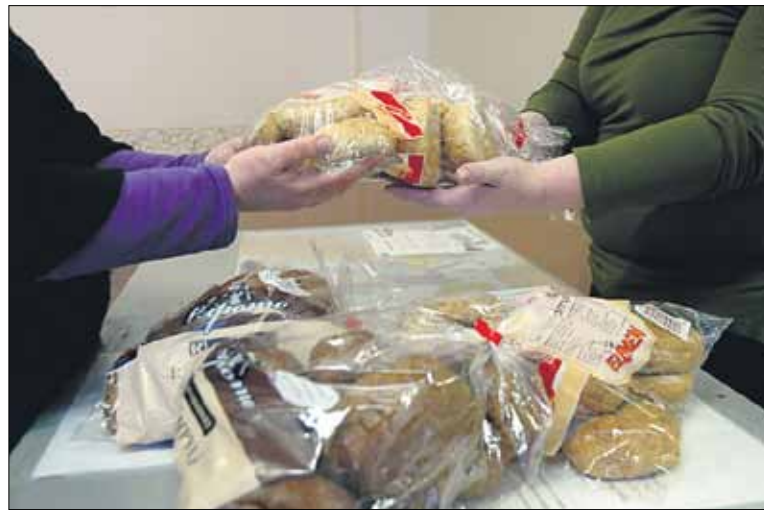
Ruokapankki Jokapäiväinen leipä jakaa ruoka-apua Jyväskylässä.

Ruoka-apun tarpeen taustalla on muun muassa työttömyys, lomautukset, suuret asumiskustannukset, ylivelkaantuminen, sairaudet ja pieni-