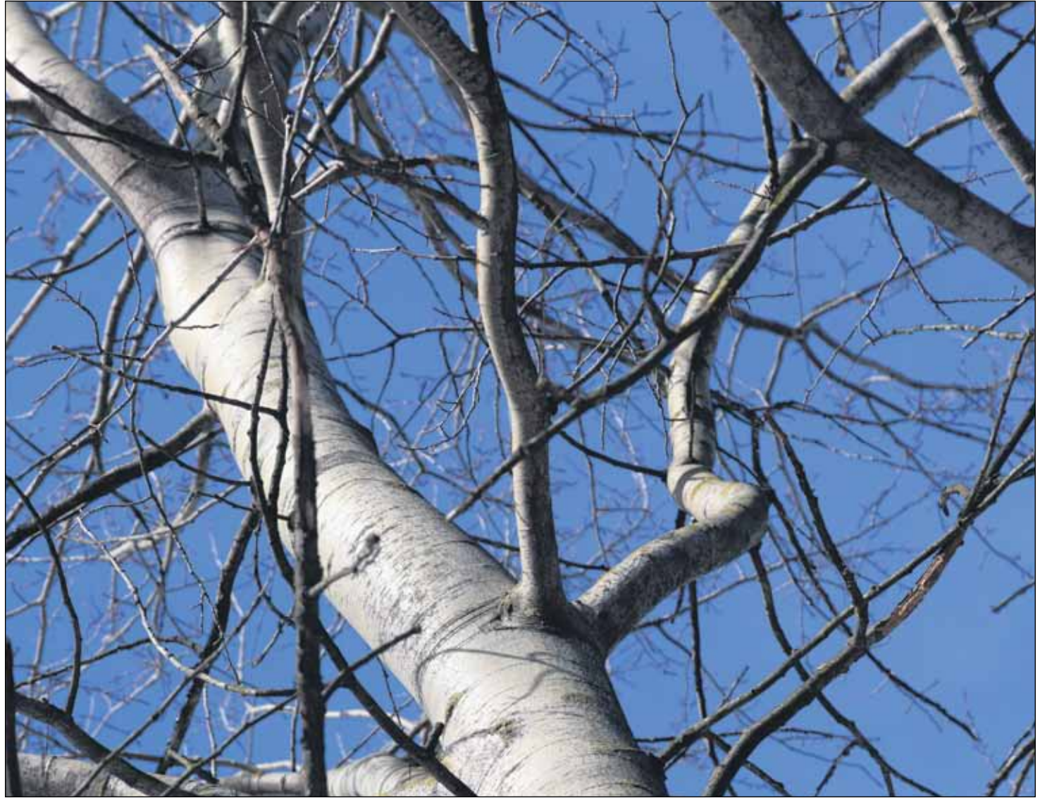
Herätysliikkeet ponnistivat syntyessään evankelis-luterilaisen kirkon sisältä. Moni liikkeistä on haarautunut sisäisesti.

- Kirkossa ajatukset jakautuvat myös laajemmissa kysymyksissä, kuten mikä on suhde uskontunnustukseen, mitä ajatellaan persoonallisesta Jumalasta tai Saatanasta. Herätysliikkeet