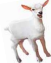
Vuohi on Toisenlaisten Lahjojen klassikko.

Toisenlainen lahja on aineeton lahja, jolla voi ilahduttaa lähimmäistään ja samalla antaa kehitysmaiden ihmisille mahdollisuuden esimerkiksi riittävään ruokaan, puhtaaseen veteen tai toimeentuloon Kirkon Ulkomaanavun työn kautta. Lahjasta saa sähköisen tai perinteisen postikortin, jossa kerrotaan lahjan merkityksestä kehitysmaiden ihmisille.