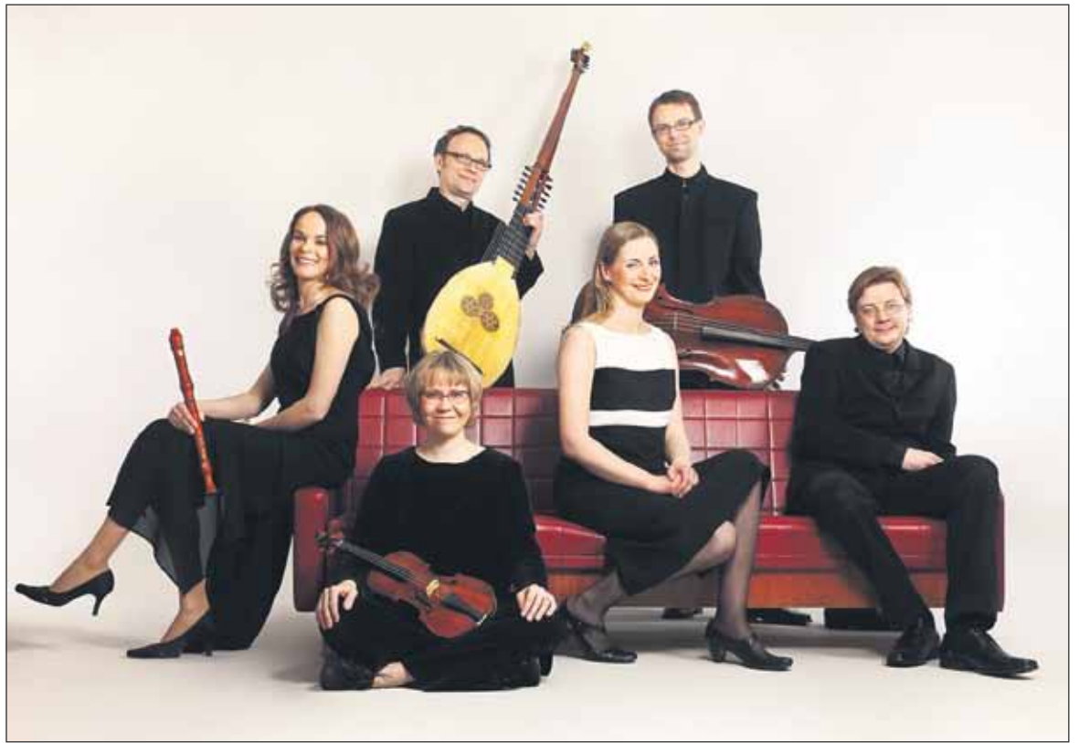
Aikakauden soittimin musisoiva Barokkiyhtye Baccano kuullaan pääsiäissunnuntaina.