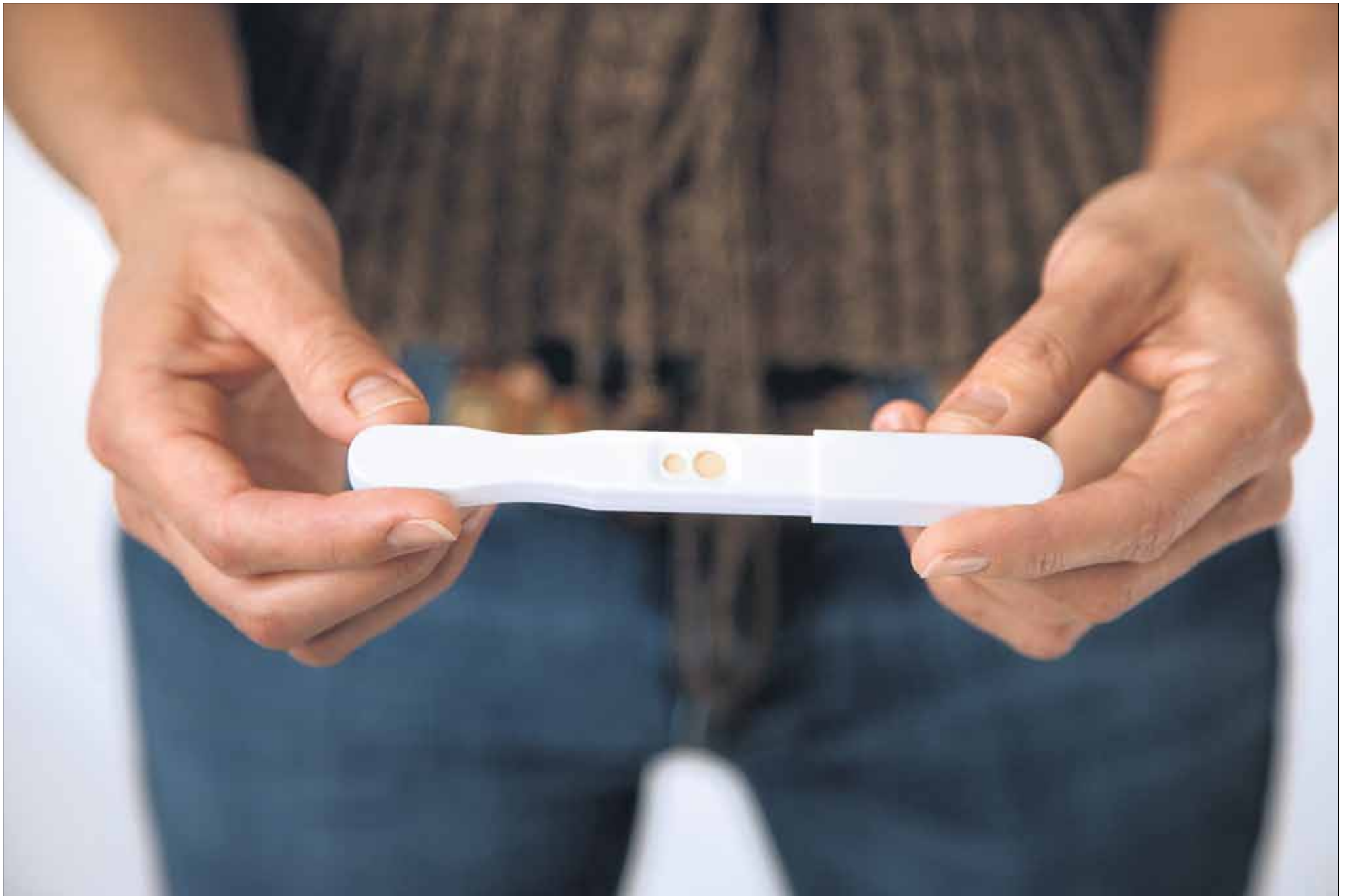
Positiivinen raskaustesti voi olla shokki, jos raskaus on vahinko, eikä elämä muutenkaan ole raiteillaan. Edessä voi olla vaikea päätös raskauden jatkamisesta tai keskeyttämisestä.

set ajatukset pyörivät päässäni. Tiedostin myös adoption mahdollisuuden, mutta pelkäsin, että kiintyisin lapseen yhtä vahvasti kuin omaan poikaani. Tiesin, etten pystyisi elämään sellaisenkaan ratkaisun kanssa.