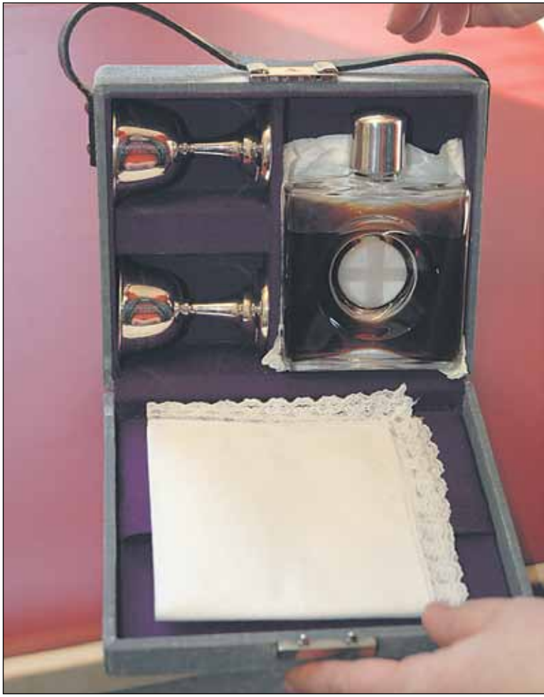
Ehtoollistarvikkeet kulkevat mukana pienessä salkussa.