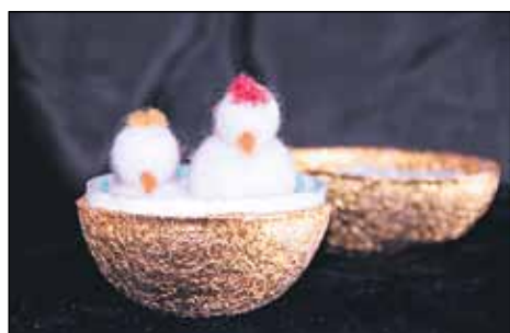
Pääsiäismunat ja koristetiput ovat uuden elämän symboleita.

Joskus kirkon evästä ei purematta niellä. Nuopponen muistaa tarkastelleensa ehtoollisleipää erään arastelijan kanssa suurennuslasilla; kyllä, se kuva esittää kirkon Jeesusta. Joku