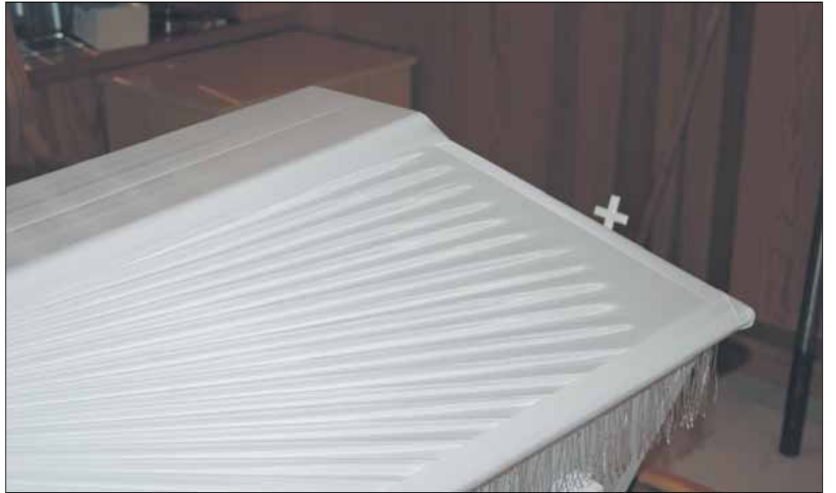
Sairaalan kappelissa omaisilla on mahdollisuus jättää jäähyväiset vainajalle.