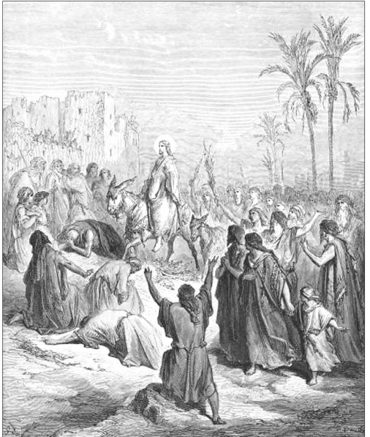
Jeesus ratsastaa Jerusalemiin. KUVA GUSTAVE DORÉN KLASSESSA KUVARAAMATUSSA.

Ja toisin kuin hippimeiningissä, asetelmia ei käännetty ylösalaisin,