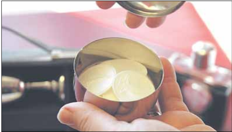
Kuoleman hetkellä moni potilas haluaa viimeiselle ehtoolliselle sairaalapastorin kanssa.