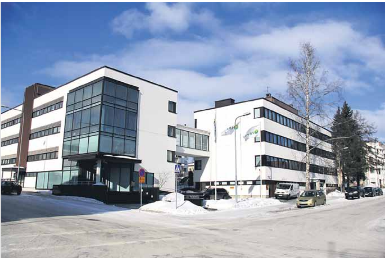
Jyväskylän seurakunnan keskeiset virastot muuttavat Tellervonkadulle.

Kirkkoherranviraston lisäksi Tellervonkadulle muuttavat kirkkoherra, Yhteisen seurakuntapalvelun johtaja, lapsityö, viestintä, kiinteistötoimisto ja Taulumäen yksikkö.