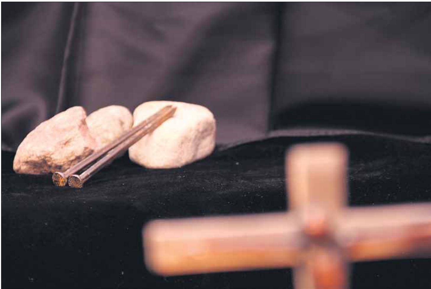
Pitkäperjantai on musta päivä.