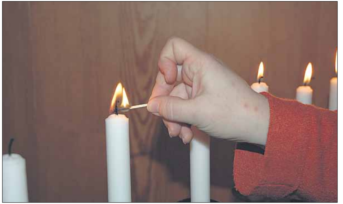
Kynttilät palavat kappelissa vainajan muistoksi.