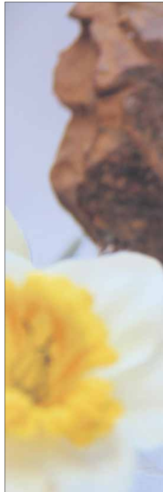
Narsissi on ylösnousemuksen kukka, sillä keväällä se murtaa

Kehitysvammaisten pääsiäiskirkossa ei jäädä suruun, vaan se on ilon juhla - kuten sen pitäisi olla meille kaikille. Kirkkohetki ei jätä pitkänperjantaihin. Myös lasten pääsiäiskirkossa käydään läpi koko kaari palmusunnuntain väkijoukon ilosta kiirastorstain tuskan ja pitkä-