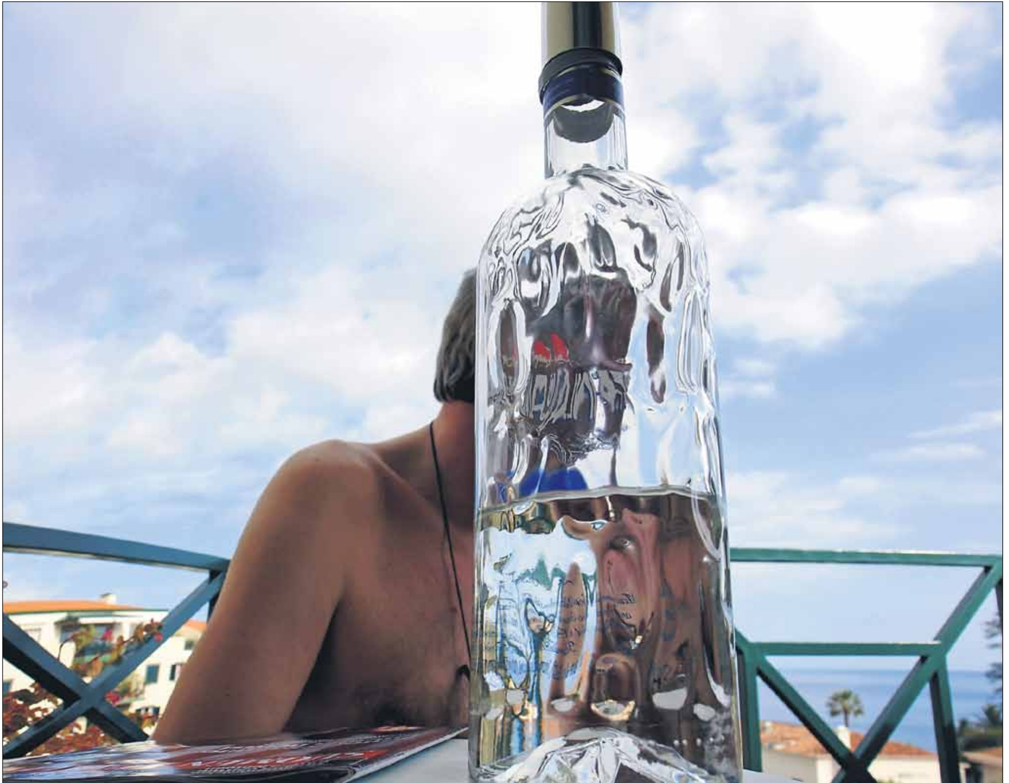
Jos sairastaa sairautta nimeltä alkoholismi, ainut vaihtoehto pysyä raittiina on jättää Aurinkorannalla se viinilasi väliin. Kulttuurilla ei voi selittää juomistaan, jos siitä on tullut ongelma.