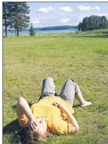
Tuleva menestyjä rentoutuu ihan urakalla?

Lempiasioiden harrastaminen virkistää ja saattaa helposti flow-tilaan ja luovuuden lähteille. Pienistäkin puuhista saa helposti uutta elinvoimaa moneksi päiväksi.