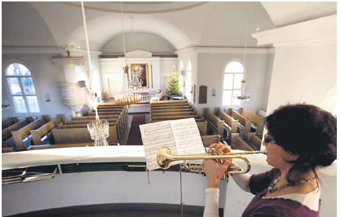
Vihkitoimitukseen voi sisältyä muidenkin kuin kanttorin esittämää musiikkia. Myös siitä sovitaan kanttorin ja papin kanssa etukäteen, ja senkin on hyvä olla sanoiltaan ja tyyliltään toimituksen kirkollisen luonteen mukaista.

Virret 816-824 ovat tuttuuhin sävelmiin sovitettuja, sanoiltaan uusia vihkivirsiä. Ne löytyvät virsikirjan uusimmasta jumalanpalvelusliitteestä, joka on myös muun muassa Kaupunginkirkon virsikirjoissa. Liiteosa on merkitty harmaalla reunuksella, ja siellä on myös vihkitoimituksen kaava. Vihkimiseen voi sisältyä myös psal-