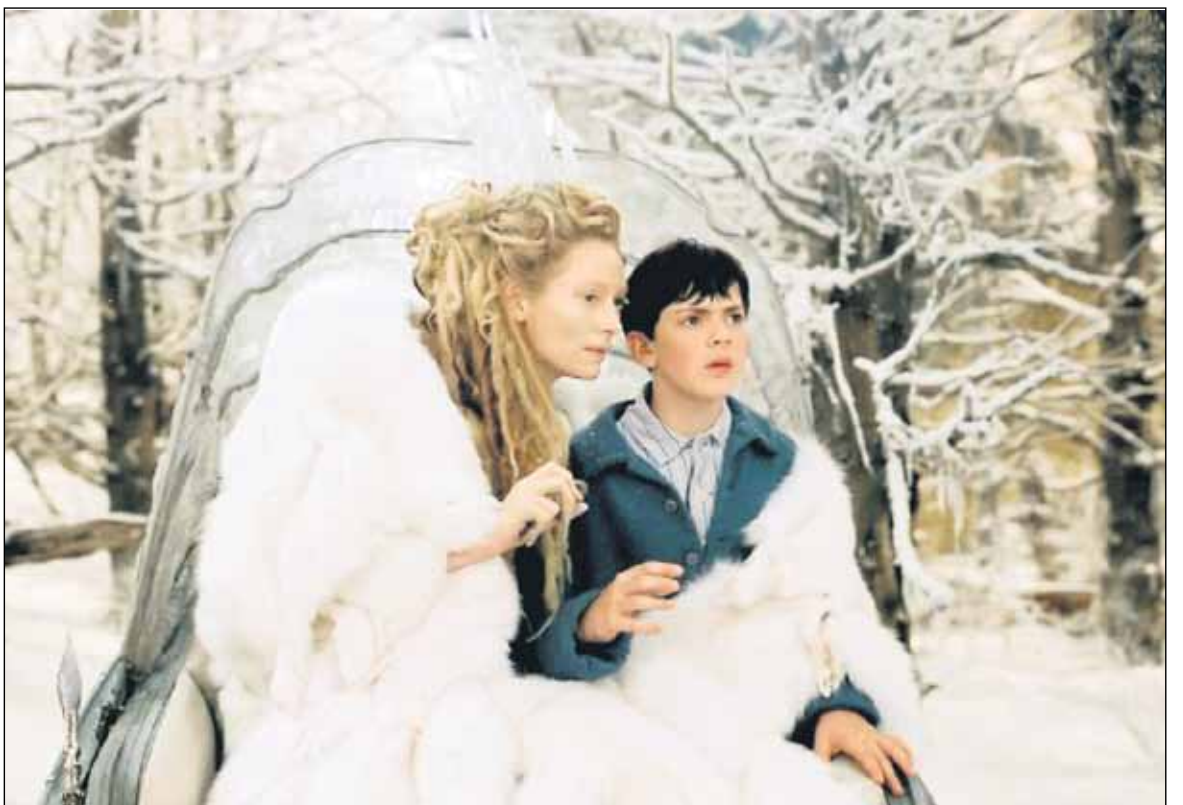
Narnia-sarja lienee kuuluisin C. S. Lewisin kirjoista. Sarjan pohjalta tehty elokuva oli komeaa fantasiaa. Kuvan esittämässä kohtauksessa Edward-poika joutuu koetukselle ja tekee kohtalokkaan valinnan. Narnia-sarja on paitsi fantasiaa, myös kristinuskon allegoria ja vetoaa lukijoiden oikeudentuntoon.