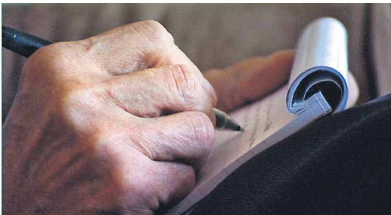
Viimeiset sanani -ohjelma antaa suunvuoron ihmisille, jotka yleensä jäävät vain hoitotoimien kohteiksi.

- Toivottavasti ohjelma herättää nyt keskustelua itse aiheesta eli kuolemasta. Sen