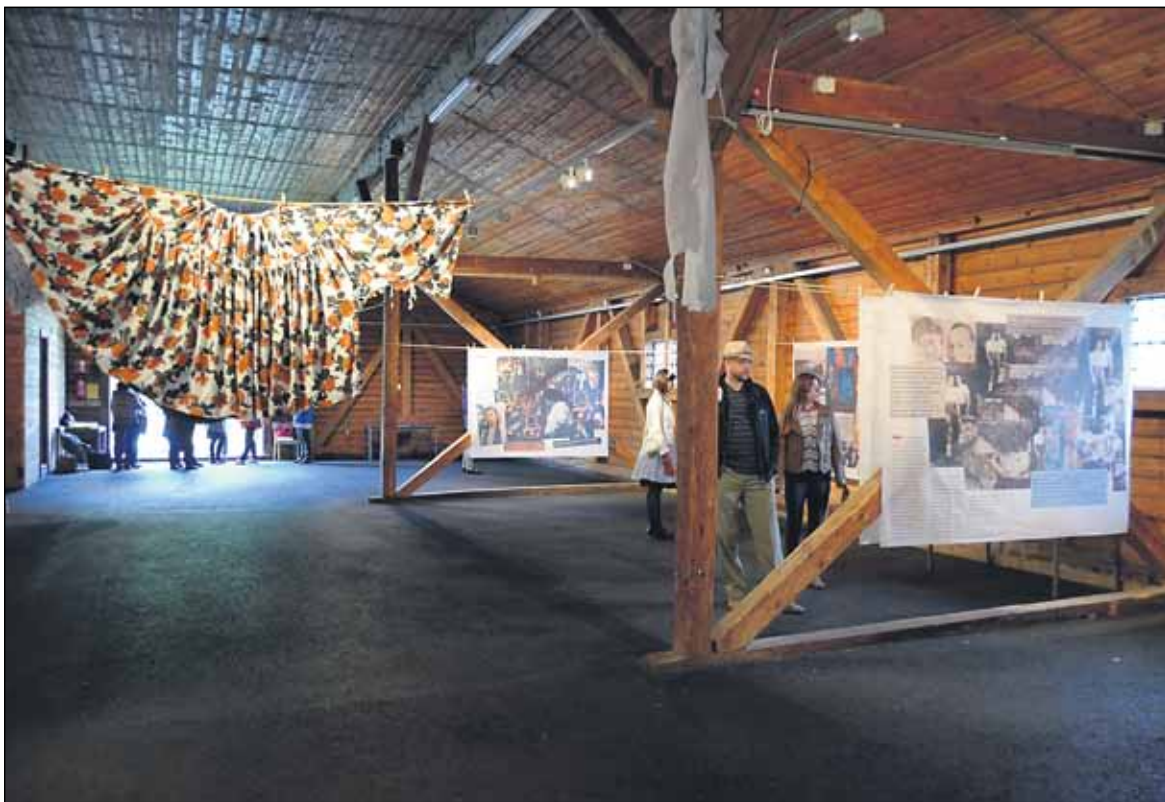
Sodanaikaiset vaatteet ja tilateokset kertovat historian tarinaa näyttelyssä.