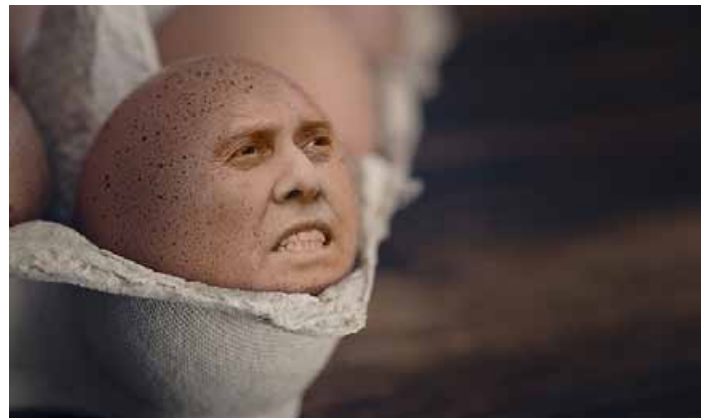
Joillekin kananmunan keittäminen voi olla jopa taidetta.

Munakellokalle puolestaan haluaa varmistaa toivotun lopputuloksen, oli se sitten löysä, puoliksi tai kypsä. Näin on myös hänen elämänsä.