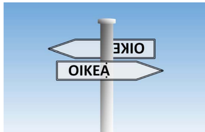
Toisen vasen voi olla toisen oikea.

Kumpi on folion oikea puoli, kirkas vai se matta? Huffington Postin tietojen mukaan sillä ei ole lainkaan merkitystä. Asia on pihvi, ja sen voi kietaista folioon ihan niin kuin parhaalta tuntuu. Folion eri-