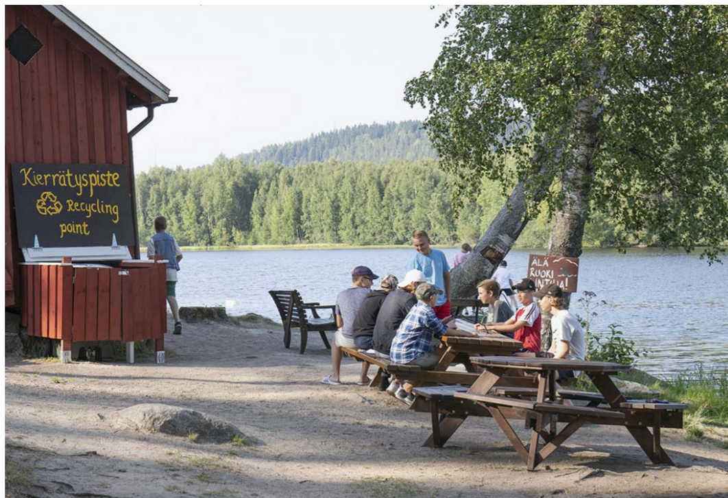
Lehtisaassa vierailee kesän aikana lukuisia ryhmiä ja opiskelijoita. Toiminta tavoittaa erityisen hyvin aikuisia kolmenkymppien molemmin puolin.

Palauteen perusteella saari mielletään kaupunkilaisten kesämökiksi, jonne on helppo piipahda, vaikka ei omistaisi venettä. Saari tarjoaa mahdollisuuden rentoutumiseen ja rauhoittumiseen niillekin, joilla ei ole omaa mökkiä tai varaa viettää kesälomaa muualla.