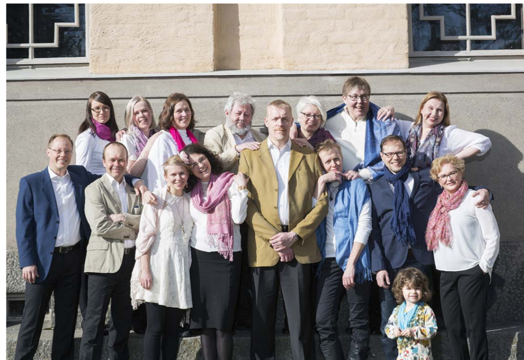
Taulumäen kirkon kuorolle Lux Auribukselle gospelin laulaminen tuo vaihtelua klassisen musiikin esittämiseen.

Jukka Leppilammen konsertti Lehtisaassa su 19.8. klo 16, Pekka Laukkarin Duon konsertti su 26.8. klo 16. Konsertteihin on vapaa pääsy.