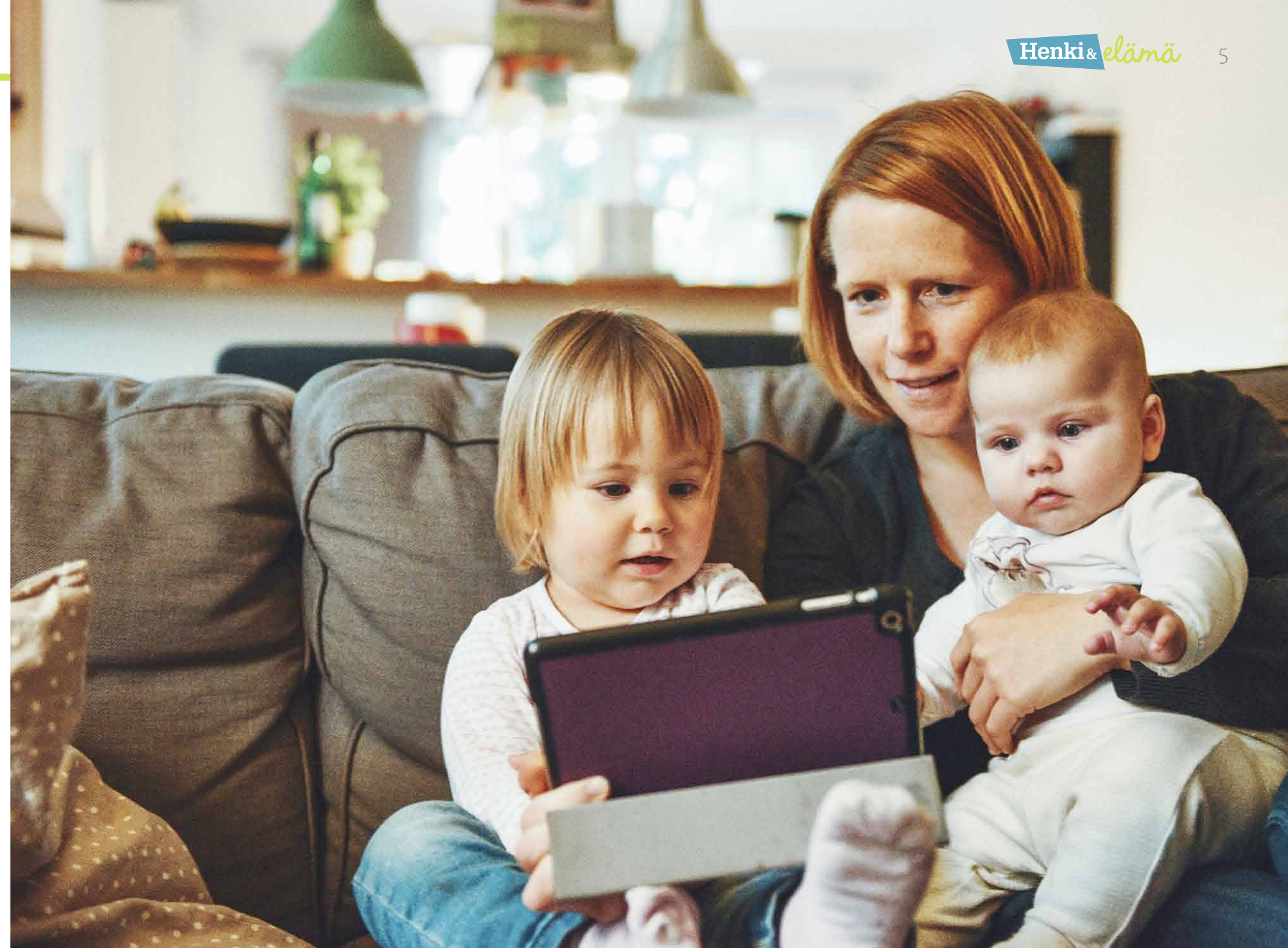
Familyroom tarjoaa helposti monenlaisia toimintamahdollisuuksia lapsiperhearkea eläville. Myös apukanavia ongelmatilanteisiin on tarjolla.

▶ Ekumeeninen vastuuviikko on Suomen kaikkien kirkkojen ja monien kristillisten järjestöjen yhteinen ihmisoikeuskampanja, jossa kirkot toimivat oikeudenmukaisemman maailman puolesta. Vastuuviikkoa vietetään 21.–28.10.2018.