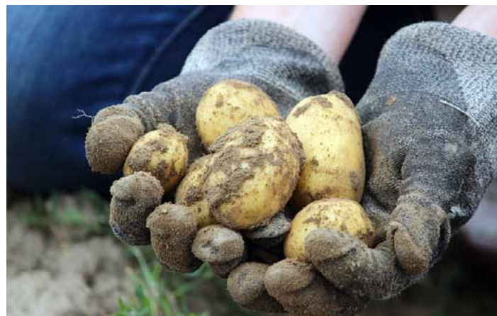
Varastoitavan perunan nosto ajoittuu yleensä syyskuulle.

Perunanosto lomana haiskahattaa puhtaasti työltä, jota tehdään selkää vääranä. Ehkä niin vääranä, että lomalta palattua tarvitsi päälle vielä sairauslomaa. Jos loman sijasta puhuttaisiin vapaajaksoista tai vapaista, niin mielikuva muuttuisi ja ongelma poistuisi. Ei kai äitiyslomaakaan kukaan miellä varsinaisesti lomaksi.