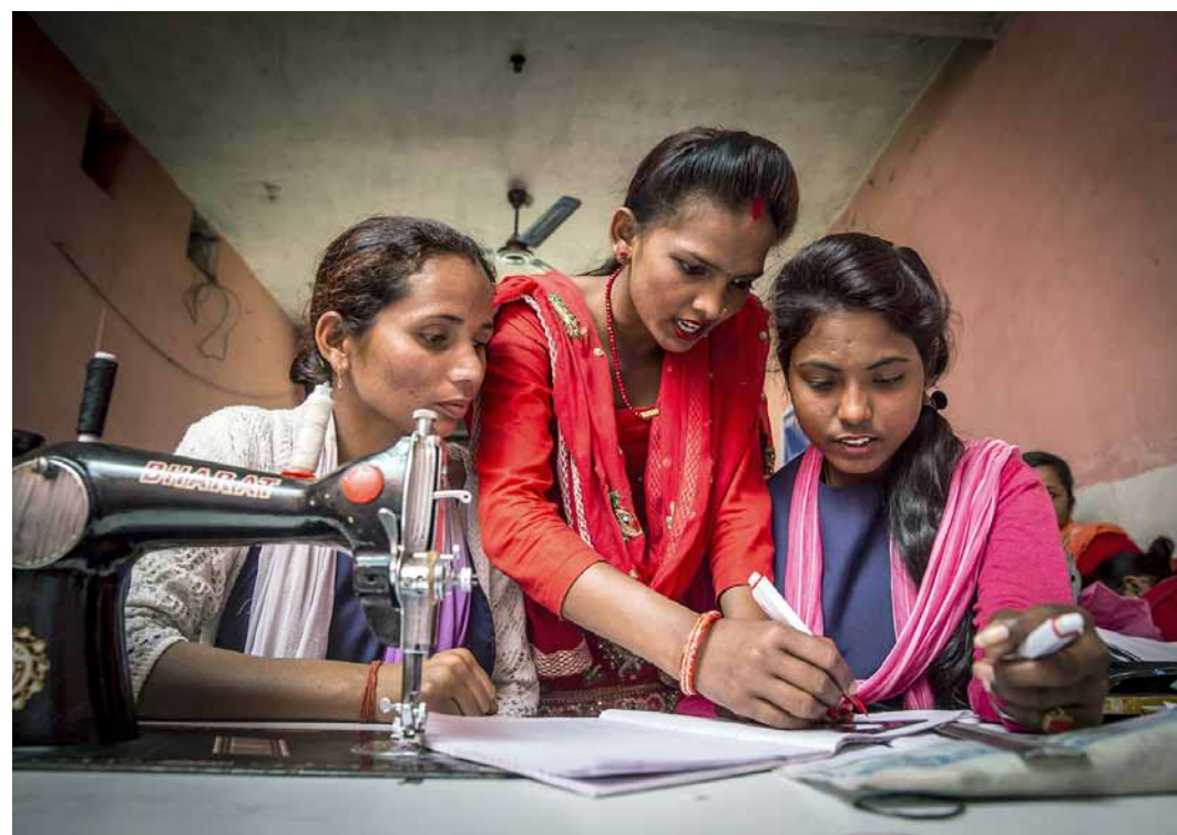
Vastuuviikon kumppanuusjärjestö Kirkon Ulkomaanapu tukee naisten ammattikoulutusta muun muassa Nepalissa.

Suomessa naisten työtilanne on varsin hyvä, ja naisten ja miesten osallistuminen työelämään lähes samalla tasolla. Toisaalta naiset työskentelevät noin kaksi kertaa miehiä yleisemmin osa-aikatoissa tai määräaikaisissa työsuhteissa, ja kokoaikatyössä naisten keskiansio