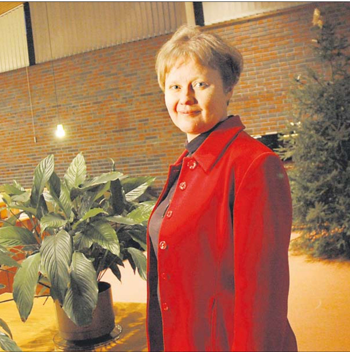
että heidän seurakunnassaan käy ihmisiä monelta maailmankolkalta.

Tutkimus tehtiin Pohjois-Tröndelagin läänissä, jossa 90 prosenttia väestöstä kuuluu luterilaiseen kirkkoon, mutta vain neljä prosenttia heistä käy viikoittain kirkossa. Tulos on lähes identtinen aikaisempien USA:ssa tehtyjen tutkimusten kanssa. Tulosten perusteella ei vielä voi sanoa, onko hyvä terveys syynä uskonolliseen aktiivisuuteen vai tuottaako ahkera kirkossa käynti hyvää terveyttä. Aiemmissä tutkimuksissa on käynyt ilmi, että hyvän terveyden ja huumorin välillä on yhteys, samoin kuin terveyden ja kulttuurin ahkeran kuluttamisen välillä.