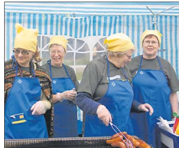
Kirkon musiikkijuhlilla on tarjolla monenlaisia talkootehtäviä. Vapaaehtoisia tarvitaan erityisen paljon ruokahuollossa. Kuva on Jyväskylän lähetysjuhlista vuodelta 2006.

– Edellisestä Jyväskylässä pidetystä vastaavanlaisesta tapahtumasta, Kirkkolaulujuhlista, on jo 66 vuotta, joten on mielenkiintoista päästä kulisissa katsomaan, miten tapahtumaa järjeste-