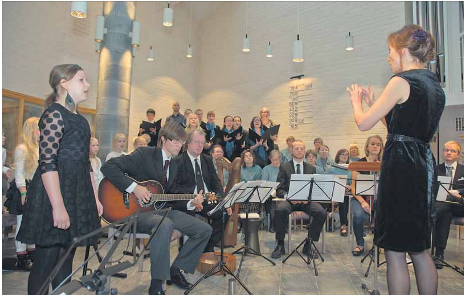
Jumalanpalvelus uudistusmonipuolista jumalanpalvelusta musiikkia Ketinmäen kirkon 20-vuotisjuhlamessussa kulttuurimuunnassa nuortesityksiä.