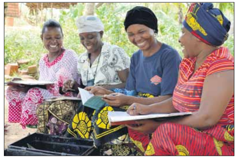
Tansanialaiset kokoontuvat viikoittain säästöryhmään.

Naisten toimeliaisuus on ihmiskunnan suurin hyödyntämätön voimavara. Parantamalla naisten elämää voidaan vähentää koko yhteis-