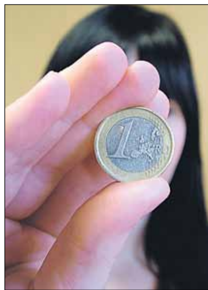
Rikas jakeleeraha. Mitä siitä pitäisi ajatella?

Osallistuja voi eläytyä Sakkeuksen ja jerikolaisten elämäntilanteisiin ja tehdä itselleen tärkeitä löytöjä. Pelisääntöjä