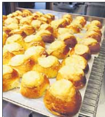
Kahden litran taikinasta syntyneitä pullia.

– Uutta sen sijaan on, että kokoonnumme leipomaan säännöllisesti, joka kuukausi.