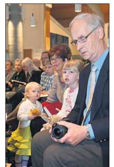
Kirkon tutkimuskeskustekiviiden seurakunnan messukävijöille kyselytutkimuksen kymmenen vuotta messu-uudistuksen jälkeen eli vuoden 2010 lopussa. Peräti 92 prosenttia koki tutkitun jumalanpalveluksen olevan sellainen kuin sen pitääkin olla. Kriittikin määrä oli pieni.

– Vuoden 2000 uudistus vahvisti selvästi yhteisöllisyyttä ja messun monialaisuutta. Mutta jos uusittuja messukaavoja käytetään ilman tekstiä taake menemistä, juurevuus puuttuu. Sen havainnon olemme tehneet, että messu-uudistaminen ja kehittäminen on pitkäjänteistä työtä, joka ei pääty koskaan.