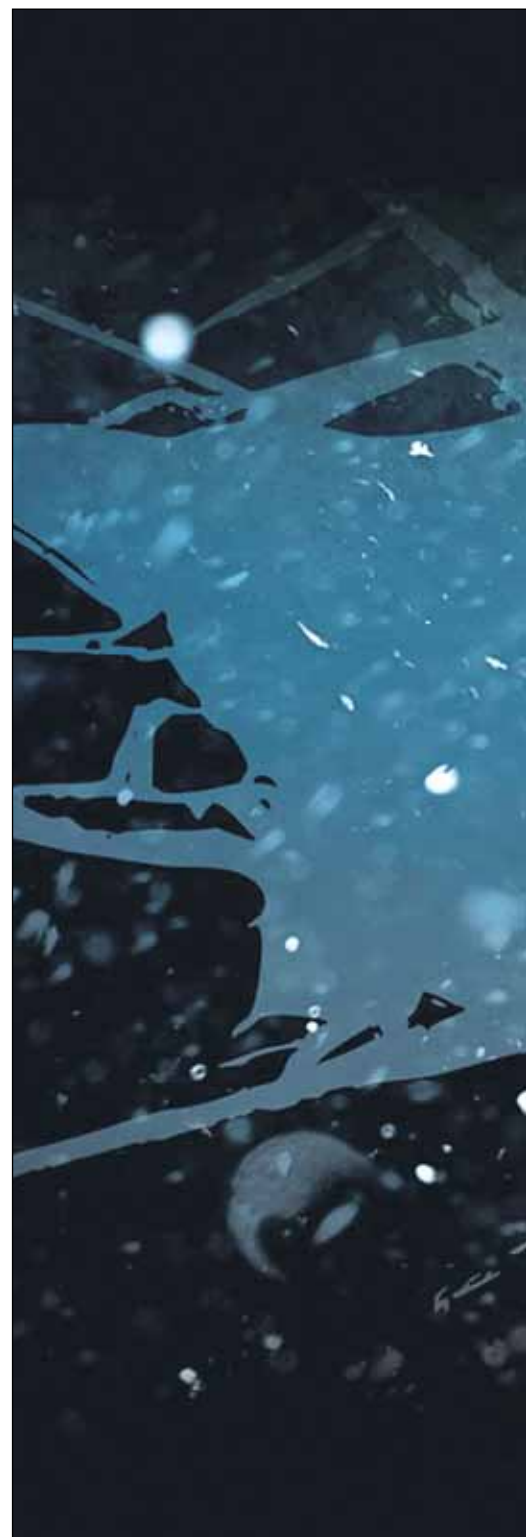
Hyvän ja pahan teemat ovat populaarikulttuurin käyttöainetta.

Sorrumme usein ”salonkikelpoiseen” pahaan eliteemme huomaamattammitsekkäitä valintoja ja pakoilemme vastuuta. Ihminen on kekseliäs selittämään pahan ja itsek-