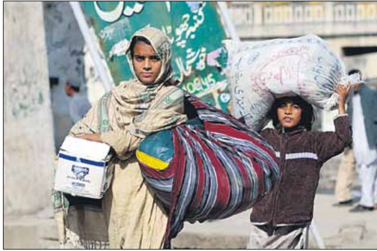
Moni kehitysmaasta pakeneva jää alueen sisäiseksi pakolaiseksi ja kuormittaa köyhää valtiota entisestään.

Uskonnonvapauden edistäminen on välttämätöntä kestävä kehityksen ja demokratian saavuttamiseksi, köyhyyden vähentämiseksi sekä kriisin ennaltaehkäisemiseksi. Uskonnonvapauden ja muiden ihmisoikeuksien kunnioitus takaa rauhan-