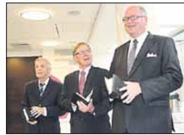
Pipliaseuran lahjoittamat Raamatut luovutettiin eduskunnan puhemiehen Eero Heinäluoman (oik.) isännöimässä tilaisuudessa.