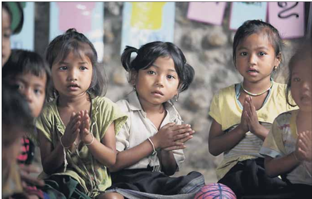
Plan tukee tyttöjä Afrikassa, Aasiassa ja Latinalaisessa Amerikassa. Tytöt saavat tukea muun muassa päästäkseen toisen asteen koulutukseen.

Tytöt tekevät nyt historiaa. 11. lokakuuta vietetään ensimmäistä kertaa kansainvälistä tyttöjen päivää. YK hyväksyi päivän vieton Planin vaikuttamistyön ansiosta. Päivä kiinnittää maailmanlaajuisesta huomiota tyttöjen asemaan ja oikeuksiin, sillä tytöt kohtaavat kaikkialla maailmassa syrjintää ikänsä ja sukupuolensa vuoksi.