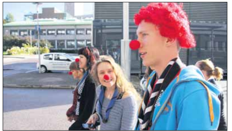
Partiolaiset tempaisevat eri puolilla Suomea. Jyväskylässä tempaistaan marraskuun alussa kirppiksellä ja Nenätöksellä.