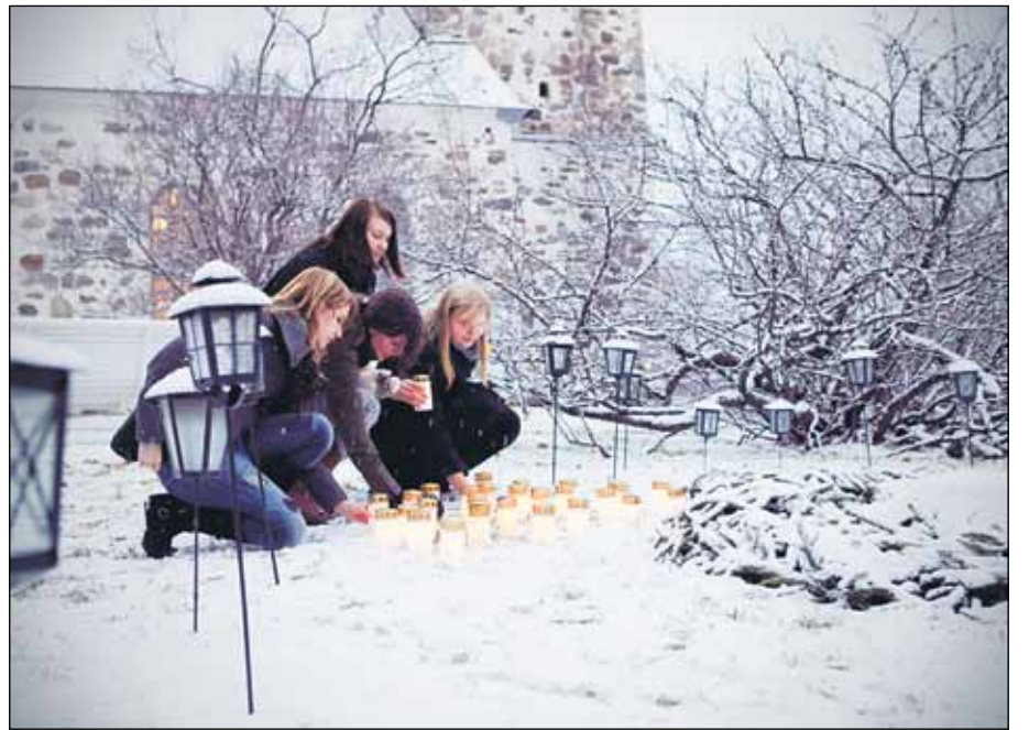
Exitus -näyttely on ollut esillä Turussa (2009) ja Kuopiossa (2010). Kuva Kuopiosta.

Taiteilija on lähestynyt surevia – läheisensä, omaisensa tai ystävänsä menettäneitä – pyytämällä heitä lähettämään hänelle ne sanat, jotka olisi halunnut sanoa tai ne kysymykset, jotka olisi halunnut kysyä. Näistä asioista koostuvat näyttelyn teokset. Näyttelypaikalla on myös postilaatikko kirjeille. Näyttelyyn on vapaa pääsy.