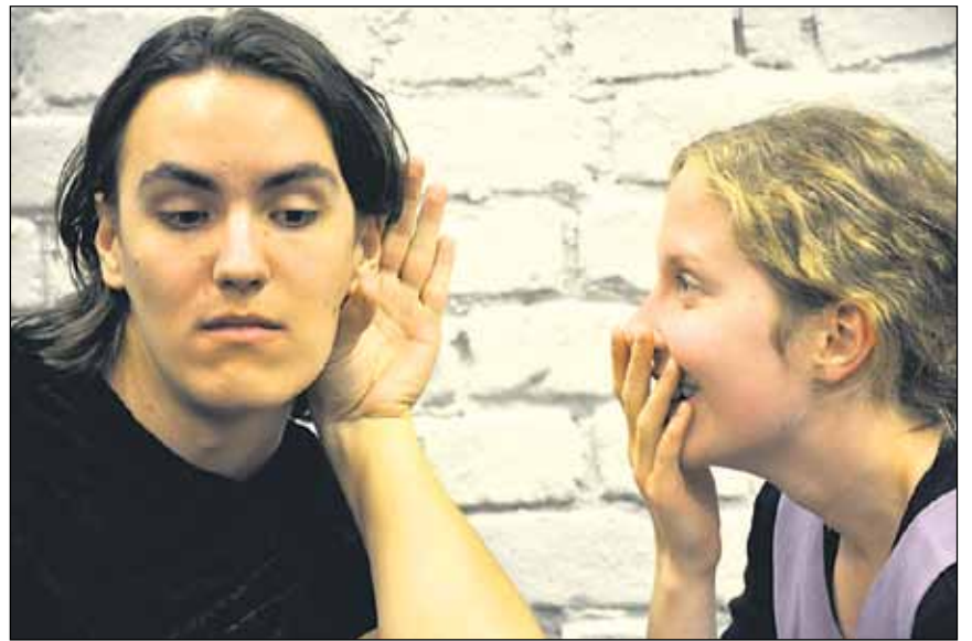
Mitä ihmettä - ei voi olla totta! Sakkeus kuulee Jerikossa kiertävän juorun palvelijalta.