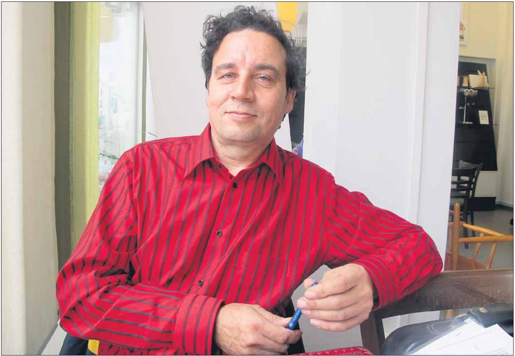
Valtaosa miesleskistä käsittelee surua itseksensä. Kipeistä tunteista puhuminen saatetaan yhä kokea miehen rooliin kuulumattomaksi heikkoudeksi, Jari Paananen toteaa.