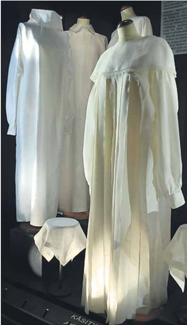
Vernumin valmistamat puvut ja arkun verhoilut maatuivat tai palavat vainajan mukana. Ne eivät sisällä aineita, jotka katoaisivat vasta satojen vuosien kuluttua.

Pajari on keskustellut paljon kirkon ihmisten kanssa hautaamisesta ja siihen liittyvistä tavoista. Yhden merkittävään uutiseen, joka olisi pa-