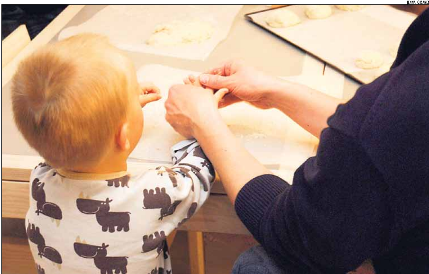
Kuokkalan Iskän kaa -illassa on oltu mm. sormet pullataikinassa. Tuemme perhettä, parisuhdetta ja vanhemmuutta monipuolisesti ja asiantuntevasti, lupaa strategia.

Päivitettyssä strategiassa on pyritty siihen, että suuntaviivat eivät ole liian yksityiskohtaisia toimintasuunnitelmia vaan riittävän väljiä, mutta merkityksellisiä painopisteitä. Seurakunnan strategia antaa perustan toiminnan ja talouden suunnittelulle. Strategian toteutumista seurataan vuosittain.