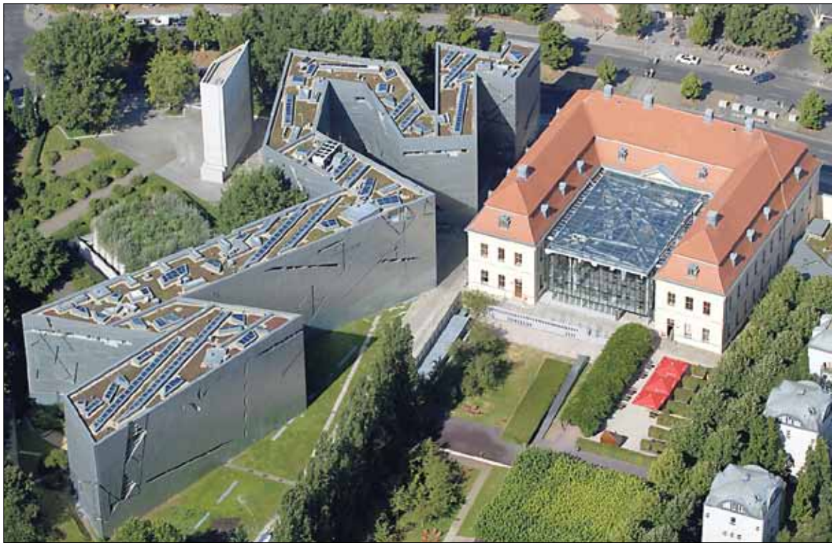
JUUTALAINEN MUSEO, BERLIINI

Berliinin sydämessä Kreuzbergissa sijaitsevan juutalaisen museon edessä partioi kaksi poliisia. Ennen kuin pääset sisälle, joudut läpäisemään turvatarkastuksen, joka on tarkka kuin lentokentällä. Sisälle päästyä meininki muuttuu, talo yllättää joka nurkan takaa.