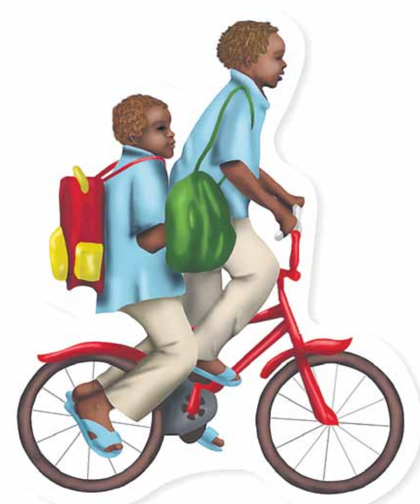
Pyörällä päästään muun muassa kouluun. Tämän vuoden lahjautuus on polkupyörä. Sen saa 32 eurolla. Lisätietoja www.toisenlainenlahja.fi

Toisenlainen Lahja on loistava vaihtoehto joululahjaksi, koska meillä suomalaisilla usein on jo kaikki tarvitsemme.