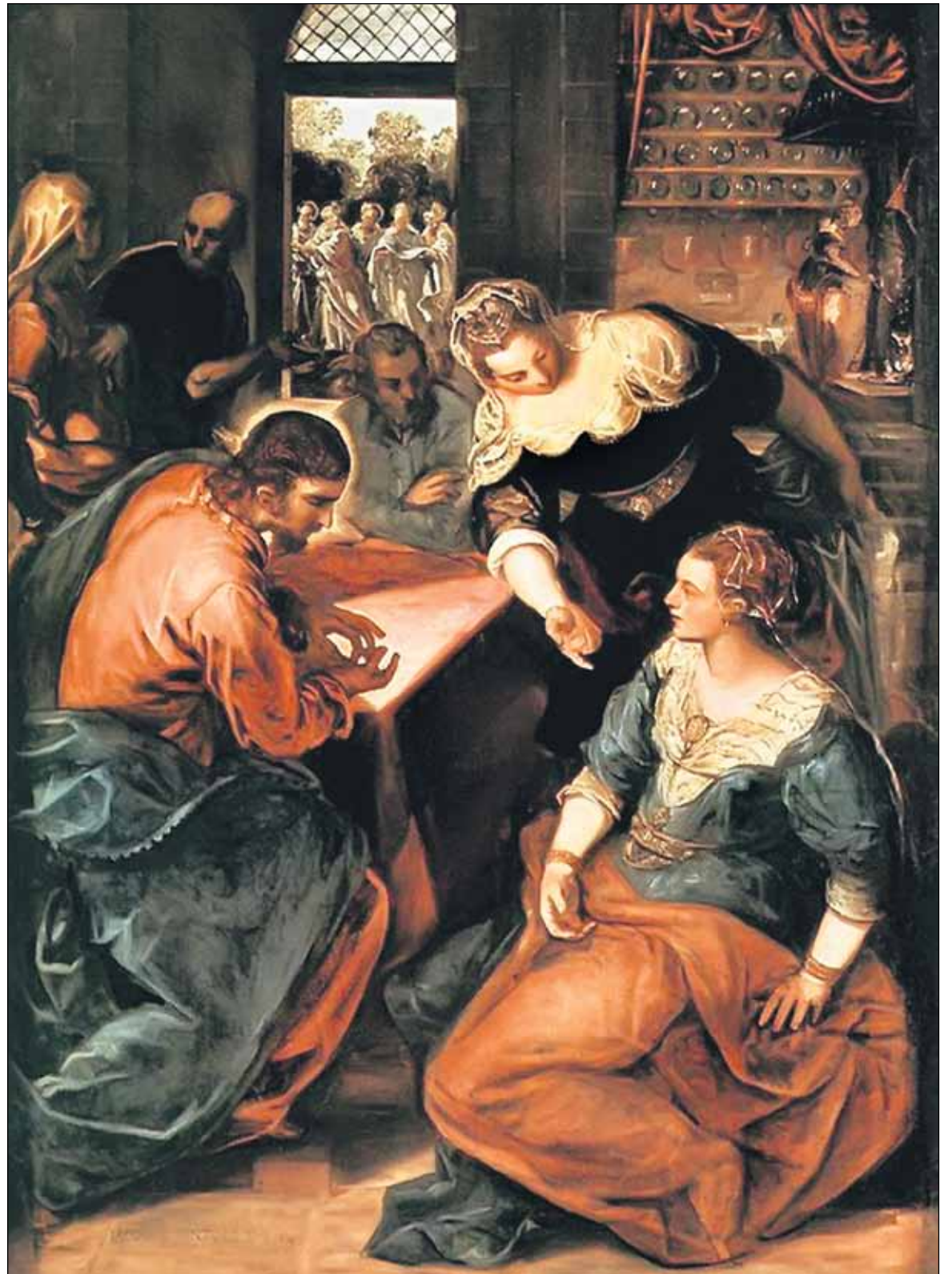
Tintoretton maalauksessa vuodelta 1571 Jeesus vieraillee kahden naisen, Marian ja Martan kotona.