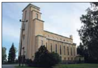
Taulumäen kirkko LOHIKOSKENTIE 2

Huhtasuon kirkossa perheiden laskiaismessu 19.2. klo 16 ja ulkoilutapahtuma. Laskiaispullan leivontaa ja paistoa, makkaranpaistoa, hevosajelua (kelivarausta) ja yhdessäoloa. Halssilan kirkolla tempaistaan laskiaistiistaina 21.2. klo 17.30. Mäenlaskua pulkalla/liukurilla, hevosajelua (kelivarausta), makkaranpaistoa, laskiaispullakahvit, yhdessäoloa. Varaa pikkurahaa mukaan.