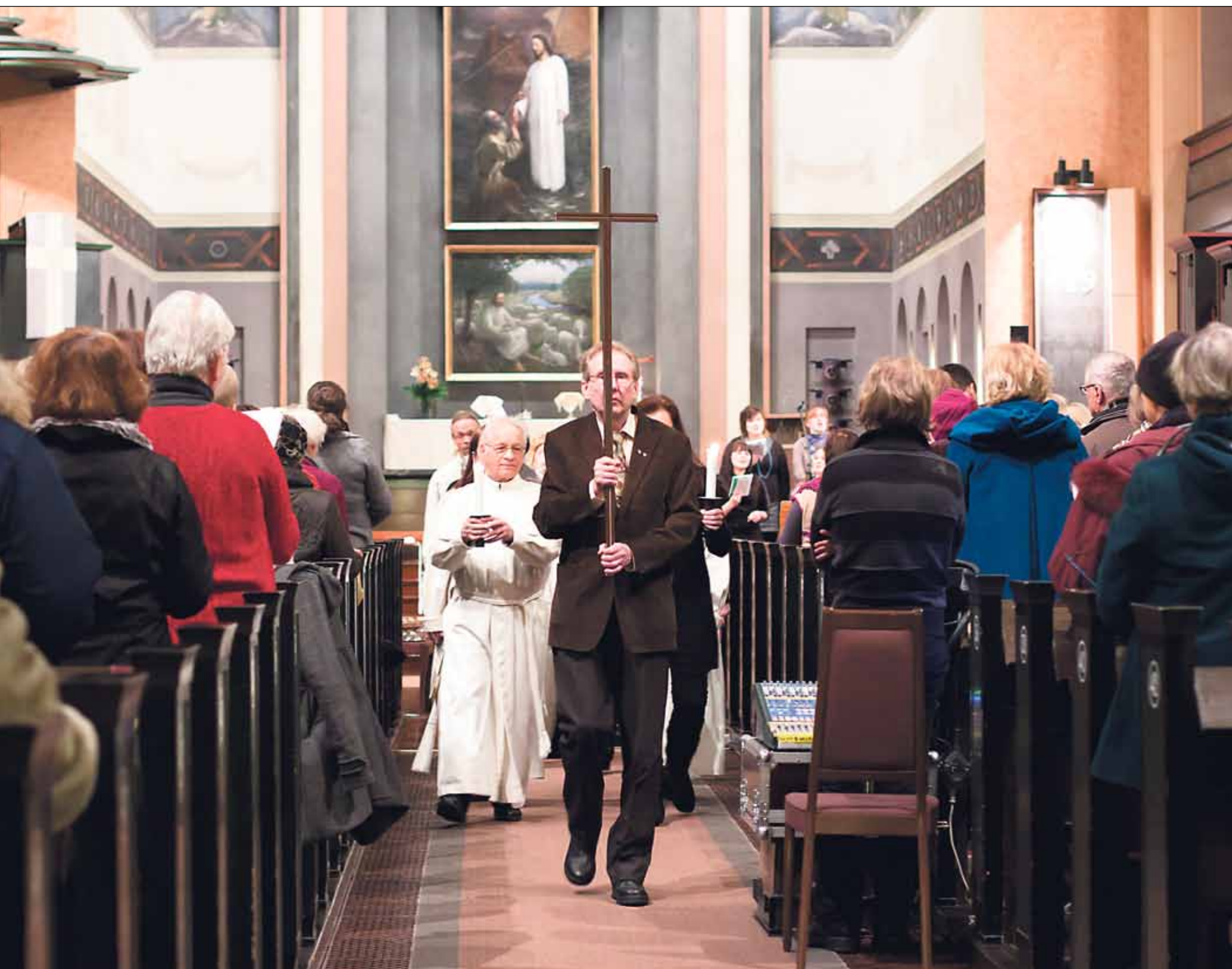
uskonväestön vastaaajista jopa 61 prosenttia käy messussa..