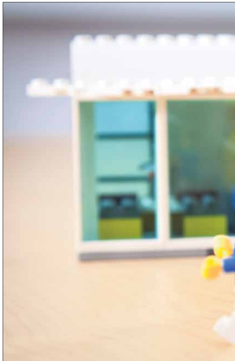
Väkivaltaan turvautuneen miehen käytöksessä tapahtuvat muutokset koskettavat laajaa ihmisryhmää

lestaan opetella sietämään aikalaisia - että asia jätetään nyt sikseen ja siihen palataan myöhemmin, kun tunteet eivät enää käy kuumina. Metodien tarkoituksena ei siis ole lakaista kiistanaiheita maton alle.