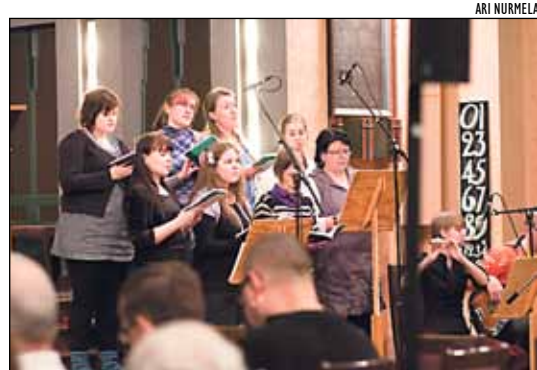
Reippaat ja mukaansatempaavat sovitukset saavat kuoron ja bändin svengaamaan virsiäkin.

Uskonasioilla on iso merkitys tuomasmessulaisille. Jopa 93 prosenttia vastaajista sanoi hengellisten asioiden olevan erittäin tai melko tärkeitä. Vastaajista jopa 61 prosenttia käy Tuomasmessussa lähes joka kerta. He kuuluvat aktiiviseen vähemmistöön, sillä yleensä suo-