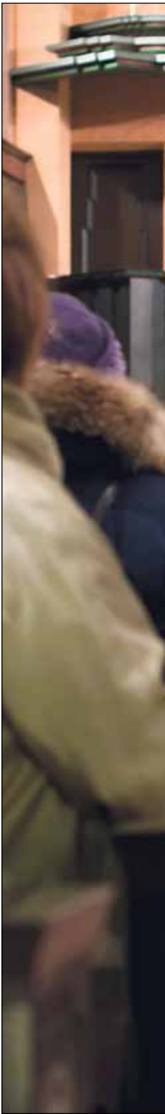
Tuomasmessusta tehdyn tutkimuksen...

Seuraavaa Tuomasmessua vietetään Taulumäen kirkossa sunnuntaina 12.2. klo 18.