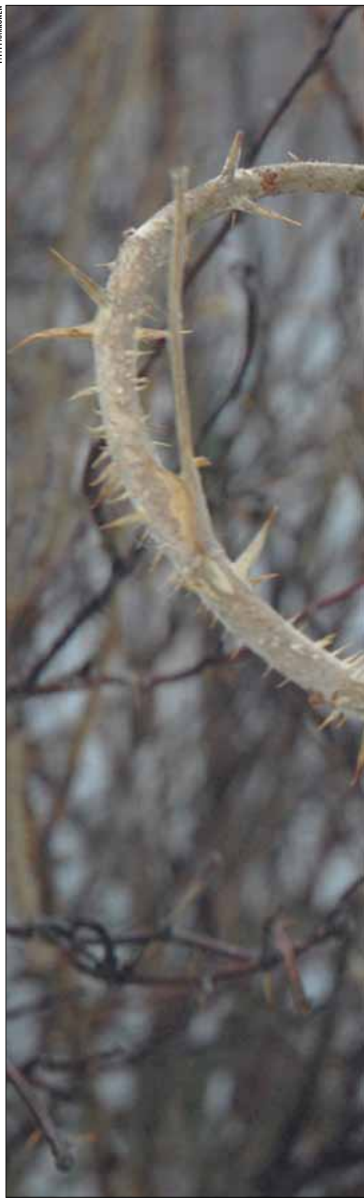
Kristus ruhjottiin, koska Jumala ei voi oikeudenmukaisuudessa

keskellä olemme kuitenkin isommissa käsissä. Ja kun pitkäperjantaina puhalletaan Kristuskynttilä mustaan verhotulla alttarilla, koen vahvasti, että Jeesus on todella Jumalan Poika."