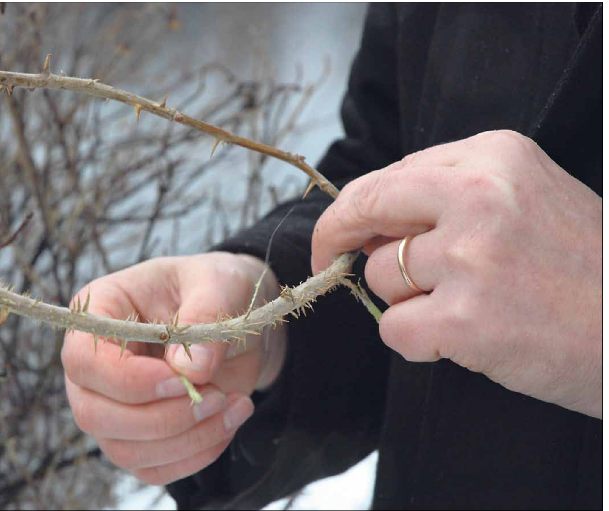
aan painaa villaisella ihmisten vääryyttä. Kun Jumala itse kärsii Kristuksessa, hän säilyttää olemuksensa ilman että luopuu oikeudenmukaisuudestaan ja rakkaudestaan.

ralaisille, jotka itkivät murheissaan. He eivät kuitenkaan uskoneet, kun kuulivat, että Jeesus eli ja että Maria oli nähnyt hänet.