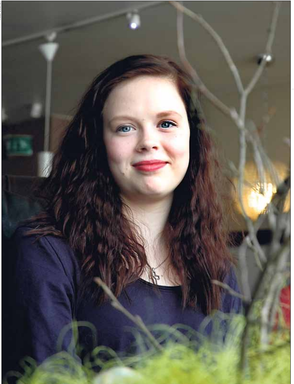
Edeltävien vuosien tapaan Jokinen aikoo hakeutua tulevana kesänä isoseksi rippileirille. – Isosena on aina niin mukava olla. On hyvä porukka ja mukavaa yhteistä tekemistä.

legat opastivat kuinka asiaan kannattaa suhtautua. Siitä oli paljon apua.