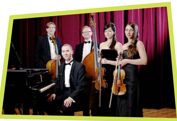
Uusi Jyväskylä Salon Ensemble