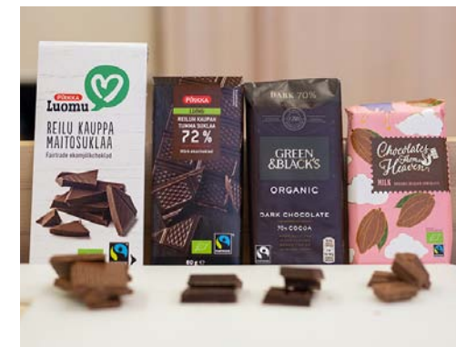
Toimitus maisteli lähimarketeista haettuja Reilun kaupan suklaalevyjä. Erikoisliikkeissä valikoima olisi ollut laajempi.

Hyvä mieli ja puhdas omatunto lisäävät makunautintoja.