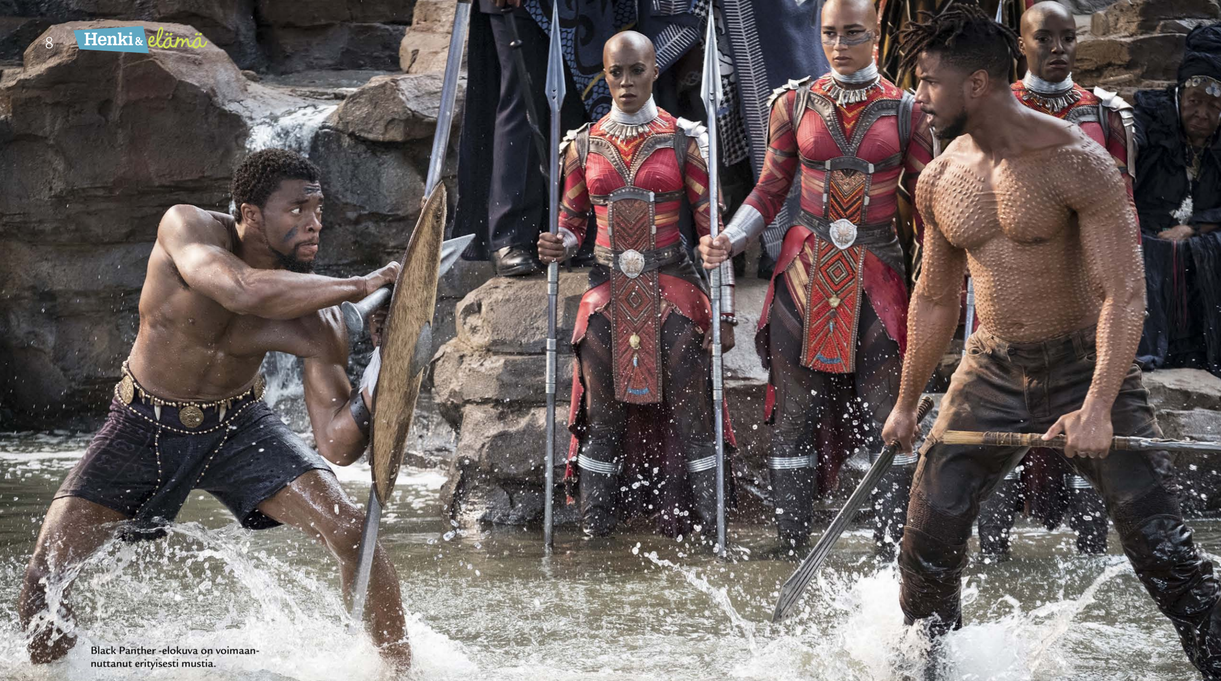
Black Panther -elokuva on voimaannuttanut erityisesti mustia.