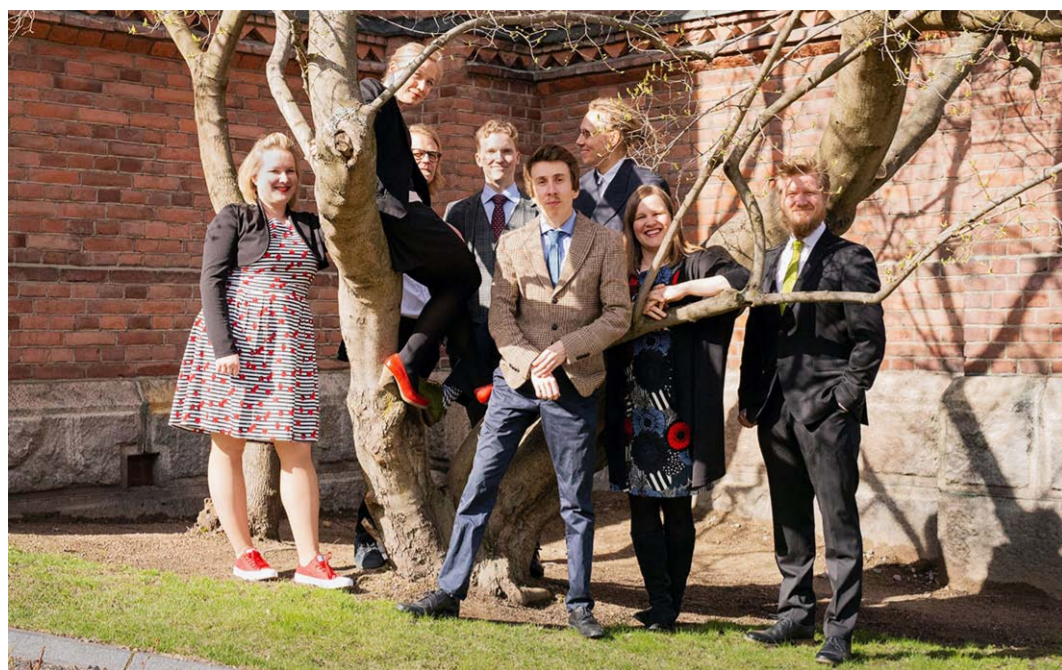
Pacem-messun soinnin takana on neljän soittajan ja neljän laulajan muodostama PB-Collective.