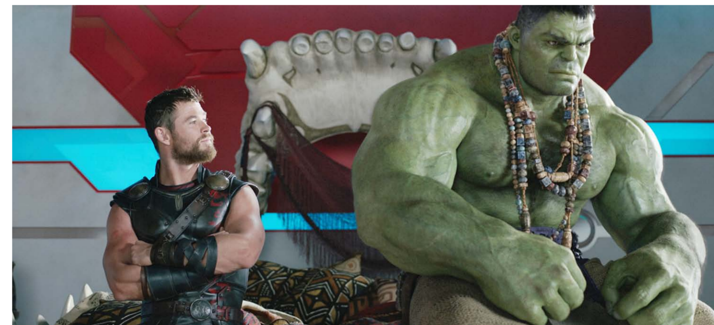
Thor-hahmot hyödyntävät skandinaavista jumaltarustoa. Thor: Ragnarök -elokuvan nimihenkilö yrittää estää maailmanlopun. Hän taistelee Avengers-supersankariyhtymästä tutun Hulkin kanssa.