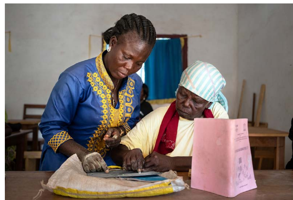
Naisten Pankin hanke Keski-Afrikan tasavallassa yhdistää toimeentulon, koulutuksen ja rauhan työtä. Kaikki aktiviteetit järjestetään naisten omalla äidinkielellä, sangolla.

Kampanjassa ovat mukana myös Kirkon Ulkomaanavun rauhaverkosto, Diakonissalaitos, Helsingin seurakuntayhtymä, Sovinnon kansanliike ja viestintätöimistö Kaiku Helsinki.