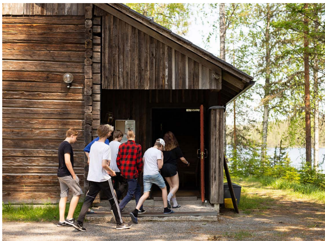
Rippikoulukyselyyn vastanneet jyväskyläläisnuoret kokivat, että rippikoulussa on hauskaa ja siellä on hyvä yhteishenki. Rippikoululaisia matkalla riihikirkkoon Vesalan leirikeskuksesta.