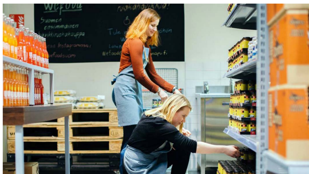
Vapaaehtoiset työntekijät palvelevat asiakkaita WeFood-myyrmälässä.