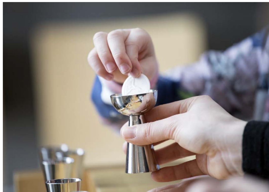
Luentojen tarkoituksena on avata seurakunnan elämän ja kirkon uskon taustalla olevia perusteita ja ajattelua. Yhtenä aiheena on muun muassa ehtoollinen.

Kevään ja ensi syksyn aikana keskustellaan muun muassa kolmiyhenteisen Jumalan käsitteestä, kirkosta hengellisenä yhteisönä, kasteesta, ehtoollisesta ja rukouksesta.